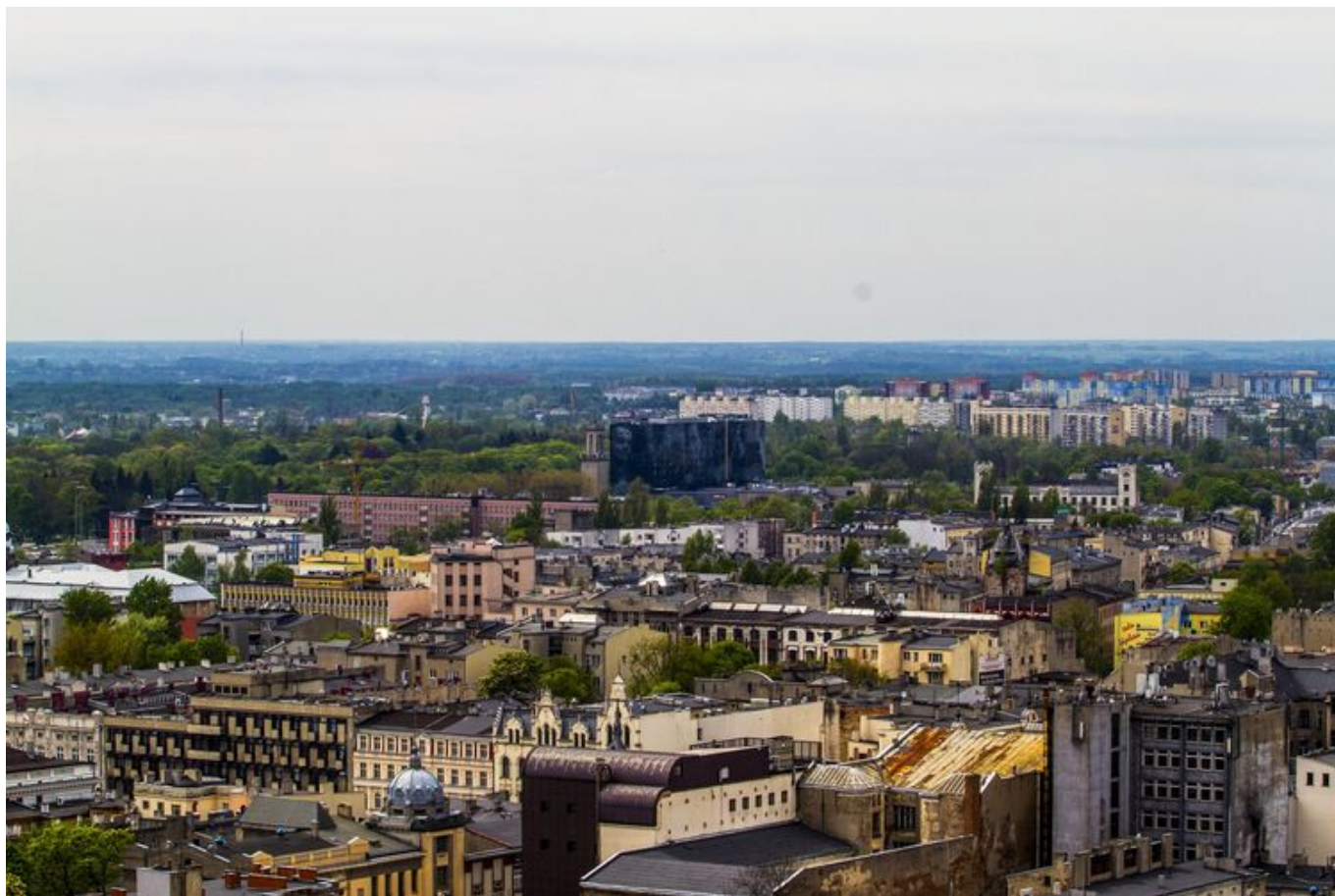
Projekt skierowany jest do mieszkańców z obszarów rewitalizowanych

Projekt "Łódzka Rewita" otrzymał 1,5 mln zł na aktywizację mieszkańców z obszarów rewitalizowanych. Pieniądze te mają pomóc w zwiększeniu przedsiębiorczości wśród tej grupy łodzian. Przypominamy, że 30 października upływa termin składania wniosków o dotację.