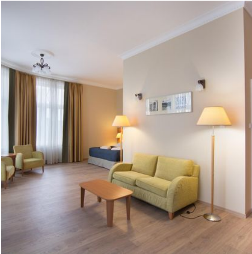
Stanowisko do obserwacji gwiazd