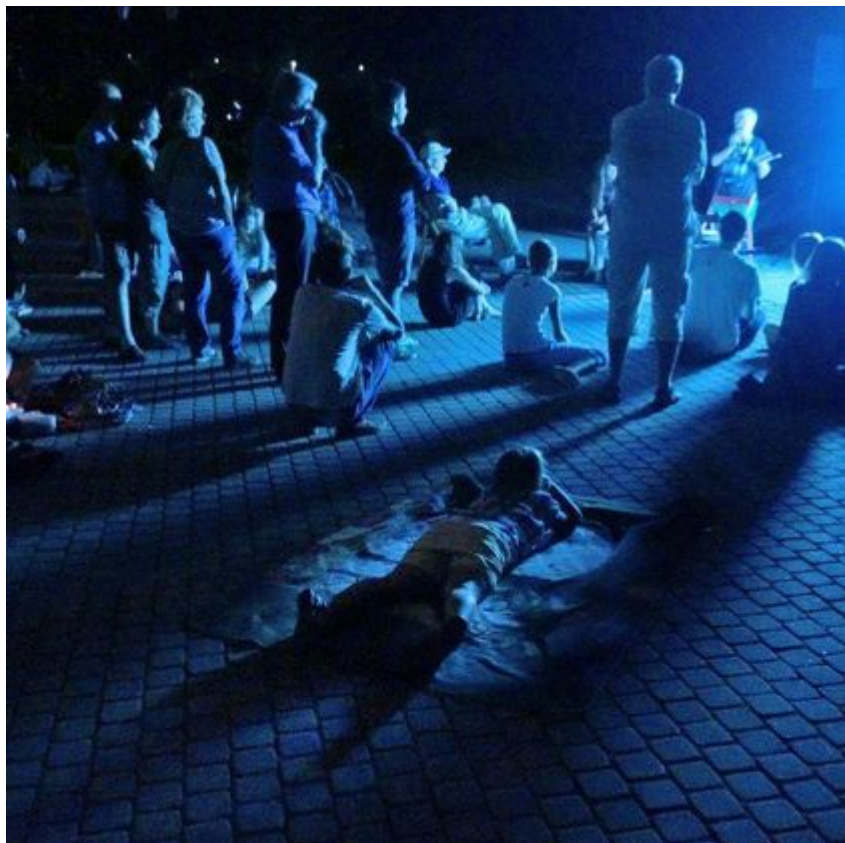
Noc spadających gwiazd w parku Źródlika

Planetarium i Obserwatorium Astronomicznego w Łodzi swoimi opowieściami i fachowymi komentarzami stworzą atmosferę tajemniczości i fascynacji gwiazdami. I tylko wtedy spełnią się wszystkim życzenia i te małe i te duże. Trzeba tylko w to mocno wierzyć.