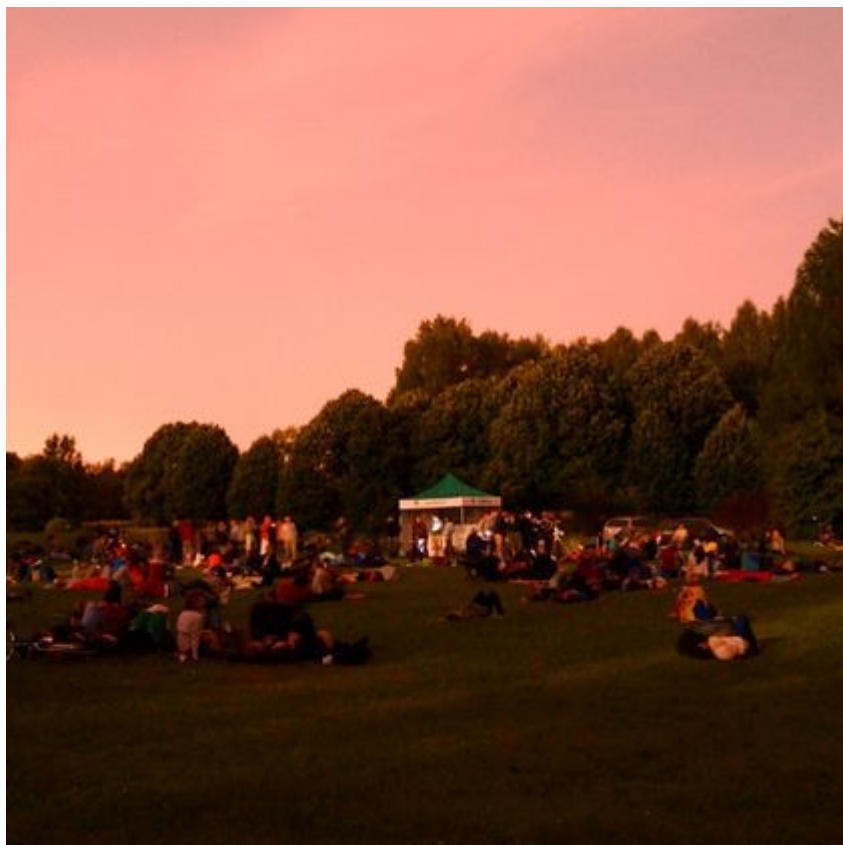
Obserwacja spadających gwiazd w Botaniku