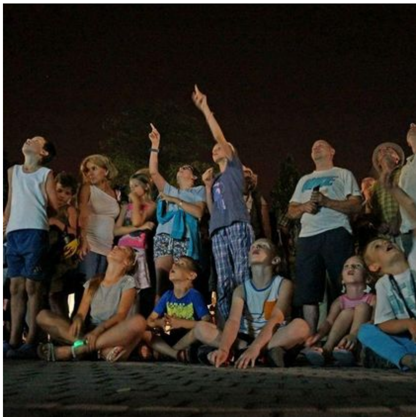
Oglądanie Perseidów w parku Źródlika