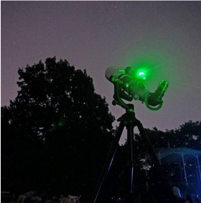
Stanowisko do obserwacji gwiazd