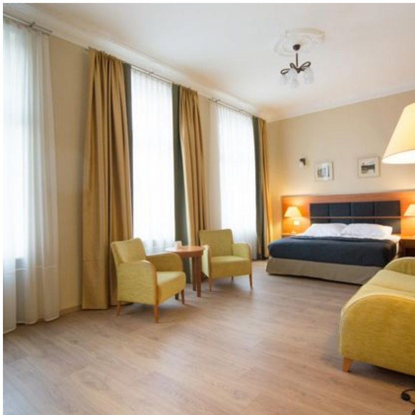
Noc spadających gwiazd w parku Źródlika

Planetarium i Obserwatorium Astronomicznego w Łodzi swoimi opowieściami i fachowymi komentarzami stworzą atmosferę tajemniczości i fascynacji gwiazdami. I tylko wtedy spełnią się wszystkim życzenia i te małe i te duże. Trzeba tylko w to mocno wierzyć.