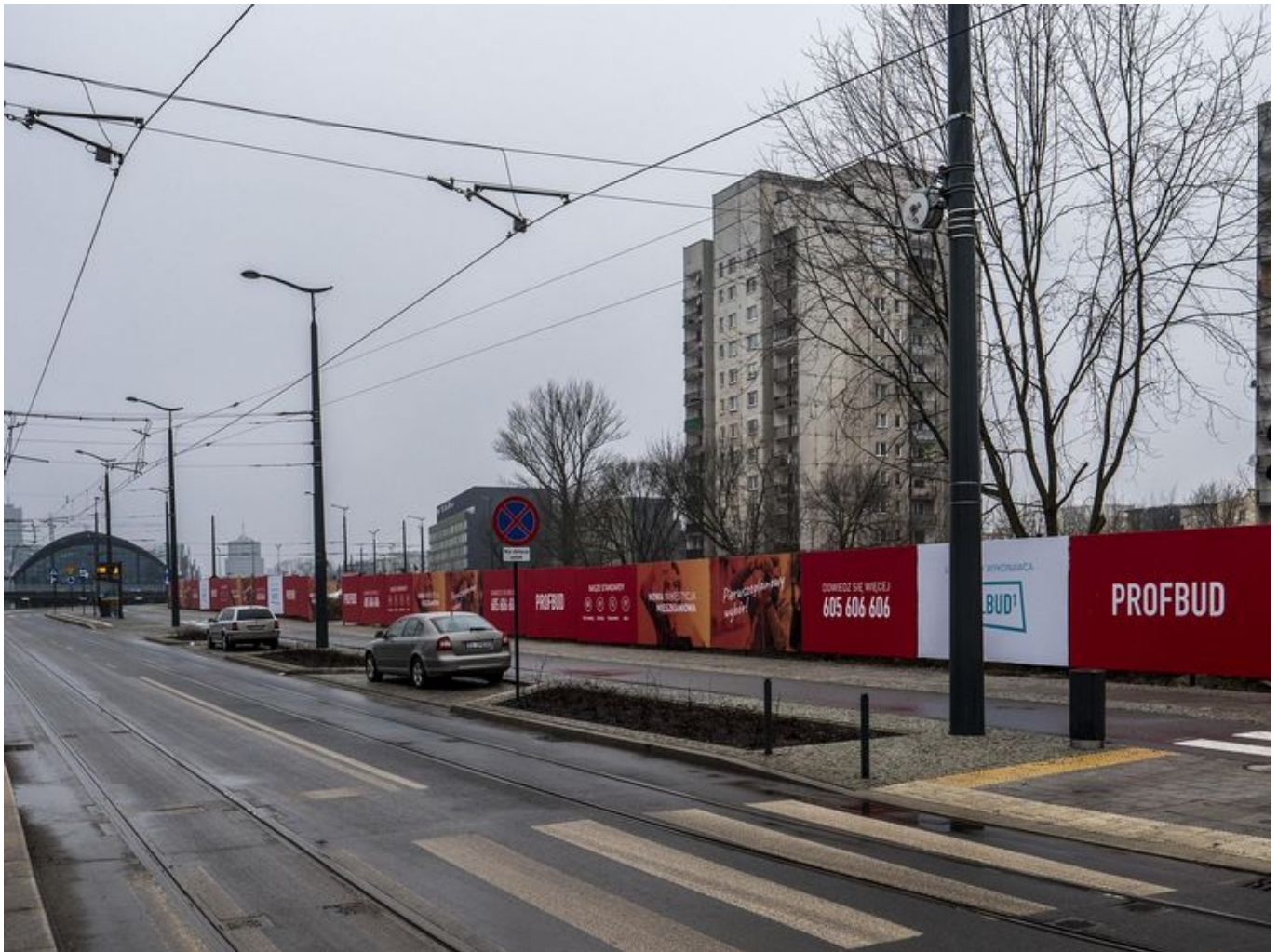
Nowe Centrum Łodzi połączy funkcje biznesowe, mieszkaniowe i kulturalne

Budowa pierwszego budynku mieszkalnego na rogu ulic Węglowej i Tramwajowej rozpocznie się w I kwartale tego roku. Ma być w nim 420 mieszkań.