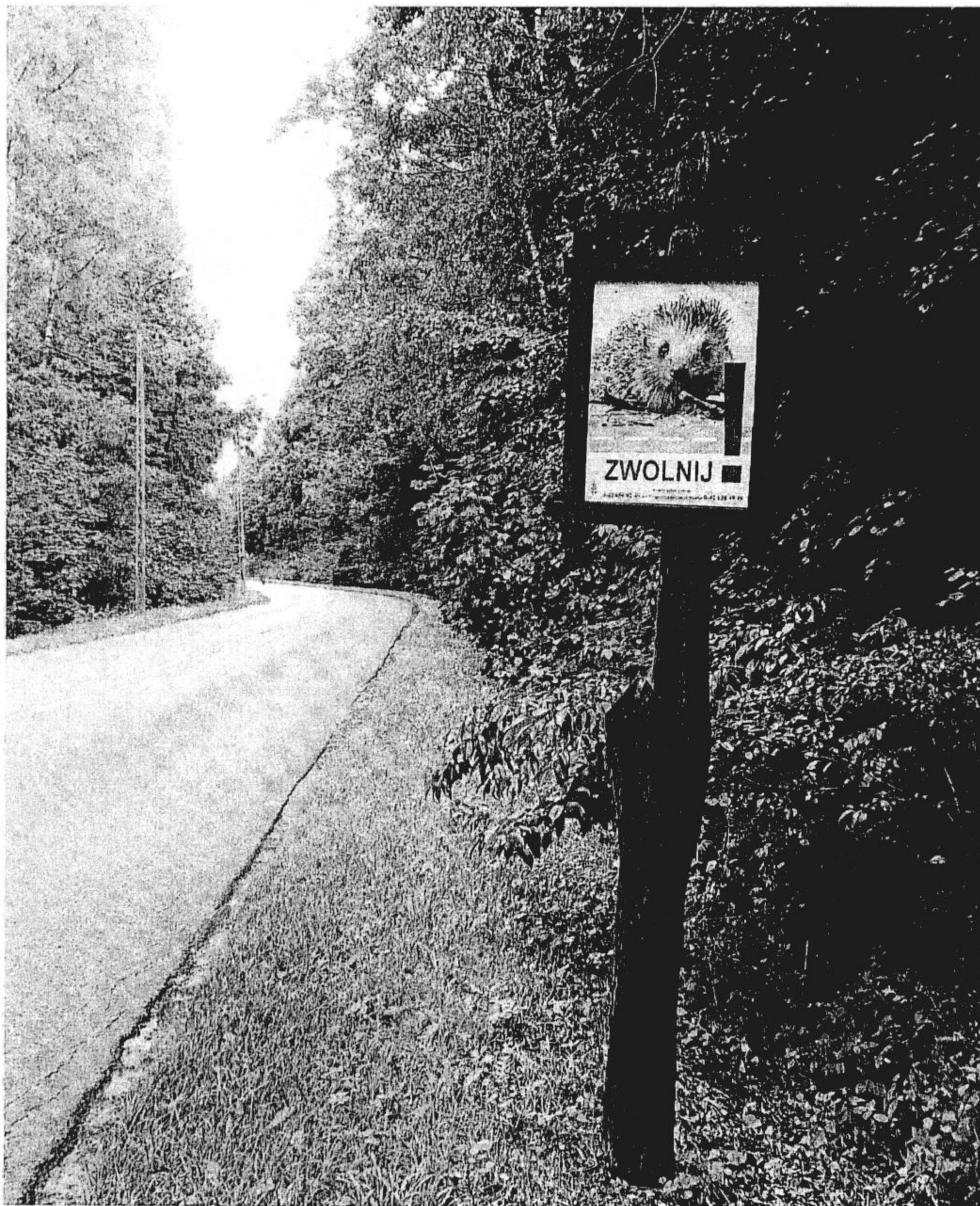
Fotografia dodatkowego znaku informacyjno-ostrzegajacego zamieszczonego przy ul. Łagiewnickiej