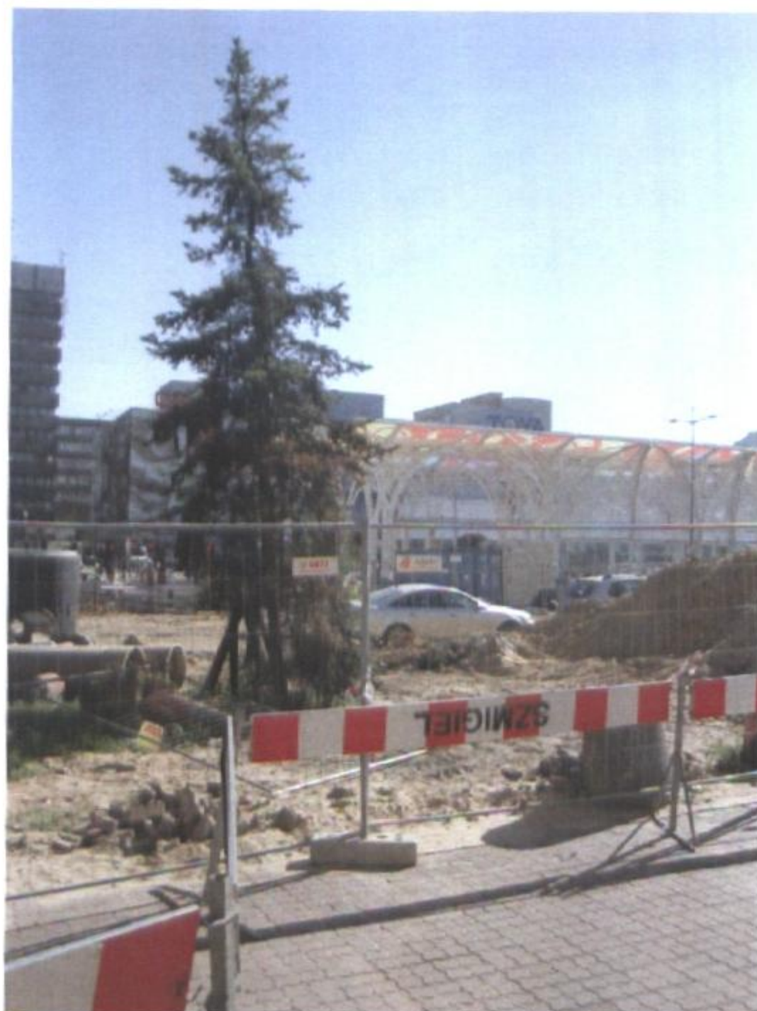
Jeszcze zachowany ale niszczący świerk. Na drugim planie, na tle samochodu – powalony, uschnięty żywotnik