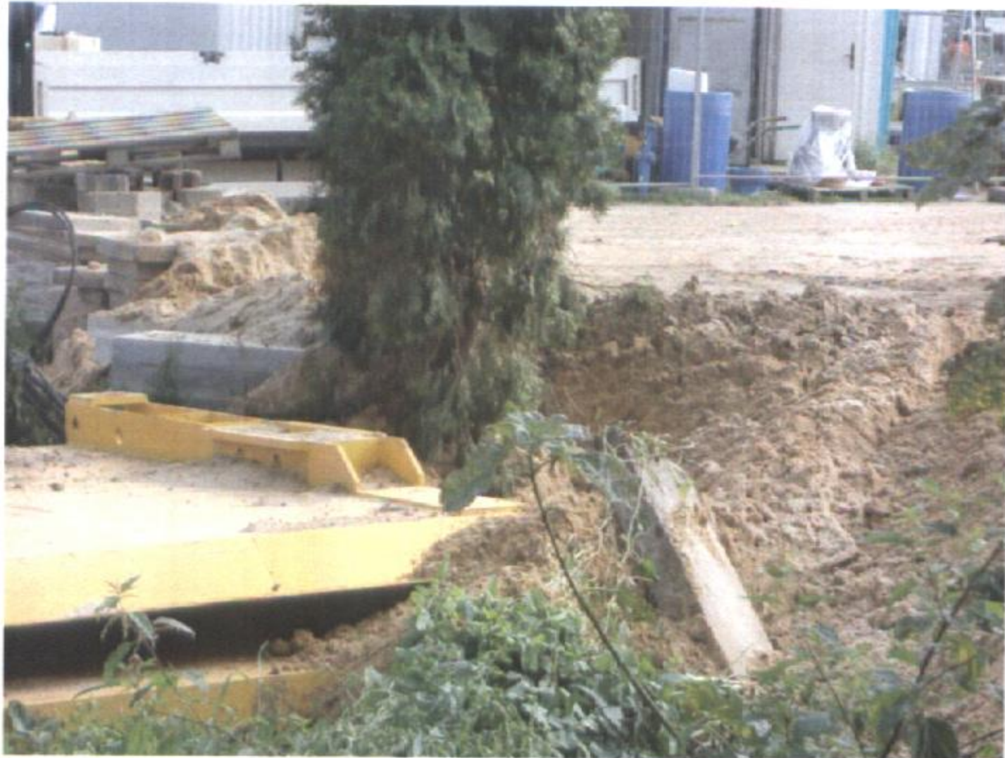
STAN W KOŃCU SIERPNI 2016 (na zdjęciach widać uschnięte i powalone drzewa)