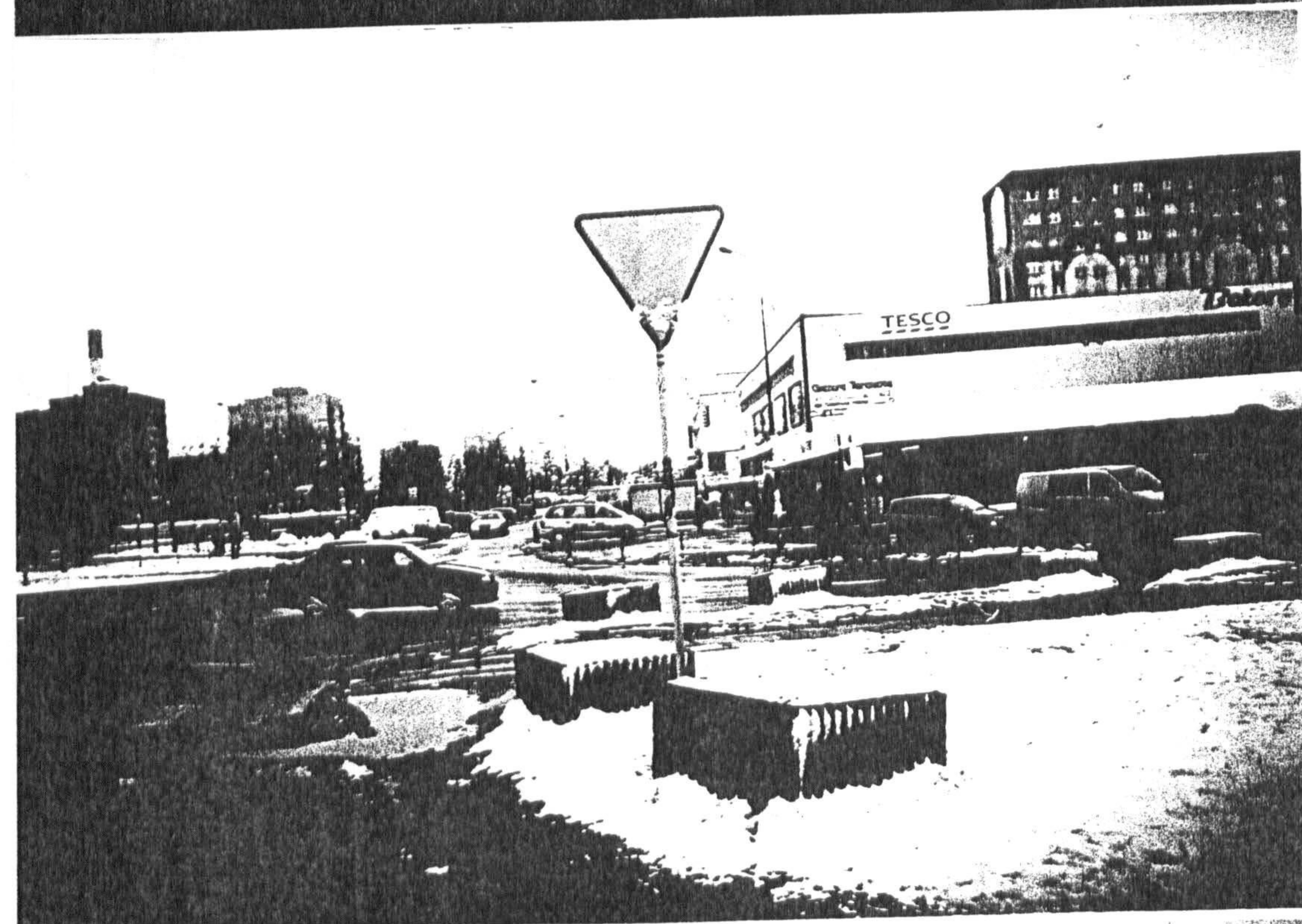
O bok rynek przy pawilonie TESCO