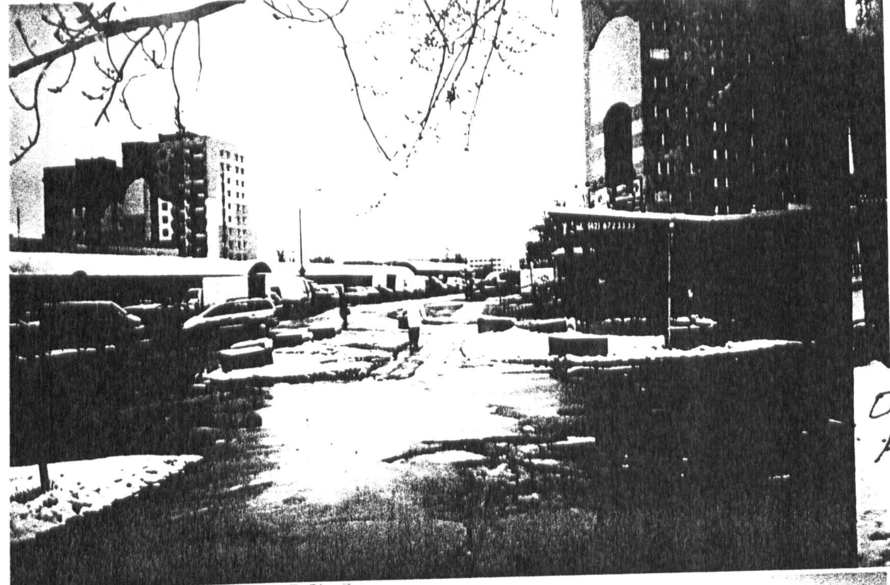
O bok pawilonu H Skrzydlewke gazony na skrzyżowaniu ul. św. Alberta i Bartoka przy ul. Puszkina