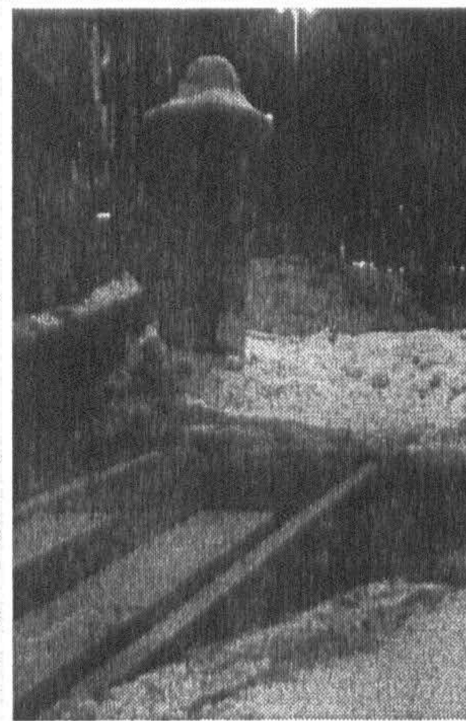
Ścieżka wzdłuż alei Mickiewicza, sobota 06.02

Propozycje Bartka można zobaczyć tutaj. My ze swej strony zgłaszamy odcinek ścieżki wzdłuż alei Mickiewicza, potraktowany jako miejsce składowania zgarniętego śniegu: