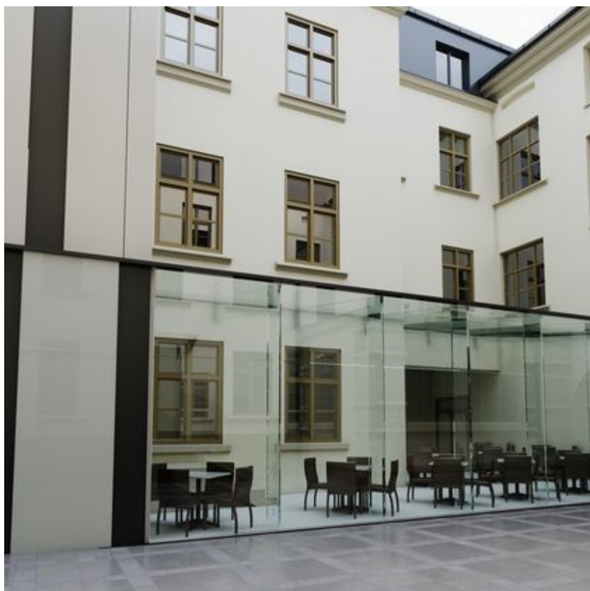
"Pietryna 40" - wizualizacja, materiały inwestora