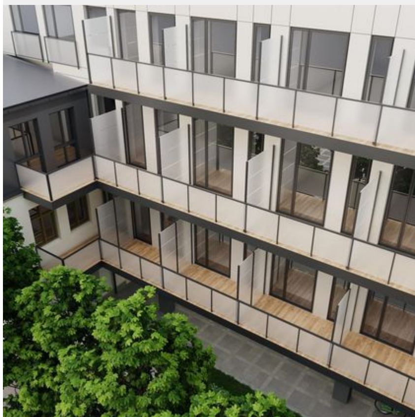
"Pietryna 40" - wizualizacja, materiały inwestora