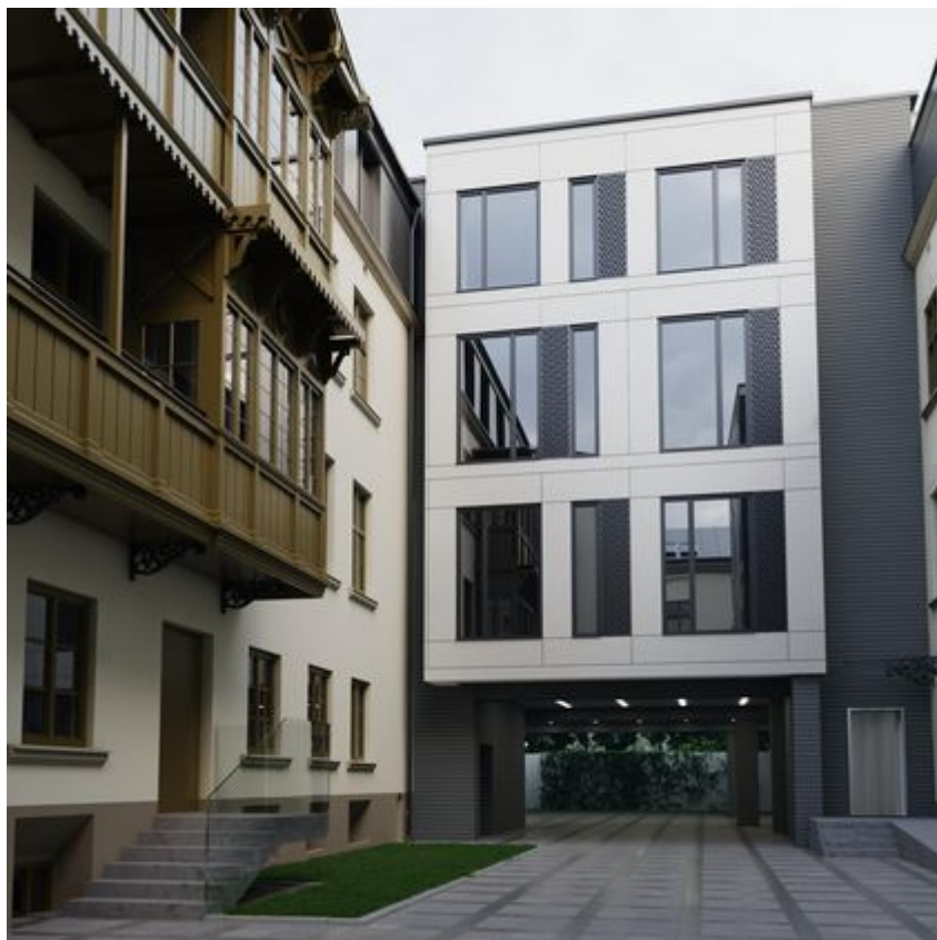
"Pietryna 40" - wizualizacja, materiały inwestora