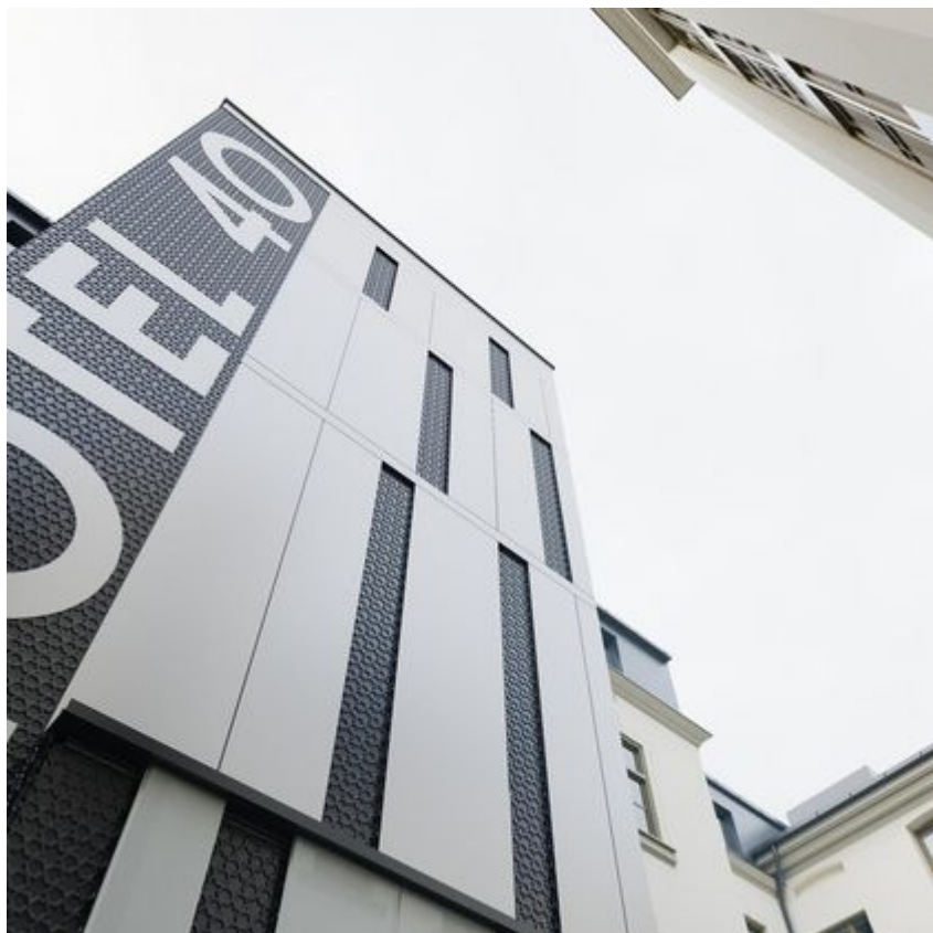
"Pietryna 40" - wizualizacja, materiały inwestora