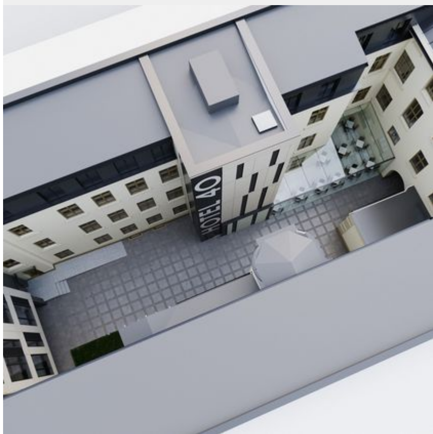
"Pietryna 40" - wizualizacja