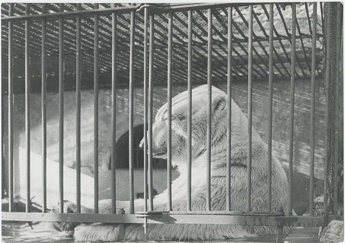
Fotografia wykonana w łódzkim ZOO przedstawia białego niedźwiedzia w klatce. Zdjęcie Ignacego Płażewskiego z

Pierwszymi zwierzętami były jelenie, sarny, owce i kaczki, a ponieważ ogród funkcjonował niezmiennie przez okres okupacji, do końca wojny wzbogacił się o 117 nowych gatunków, w tym o zwierzęta egzotyczne, takie jak słoń, tygrys, lwy, hieny, wilki, pawiany. Nieustająco rozbudowywano infrastrukturę, a w początkach lat 50. XX wieku ogród powiększono o 7 ha. Powstały: dział ptaków, zwierząt kopytnych, drapieżnych i małą, a w kolejnych latach jeszcze: dział małych ssaków (1954), akwarium (1956), wiwarium (1956), wybieg dla dzikich kotów (1968), niedźwiedziarnia i żyrafiarnia (lata 80.). W latach 90. i w ostatnich dekadach poczyniono szereg inwestycji, m.in. w akwarium, pomieszczeniach dla jeleni, zbudowano ptaszarnię, motylarnię i wiele innych udogodnień. Obecnie teren przebudowywany jest pod nowoczesne Orientarium, które pozwoli podziwiać egzotyczne zwierzęta i rośliny w nowych komfortowych warunkach, przy pomocy nowoczesnych rozwiązań.