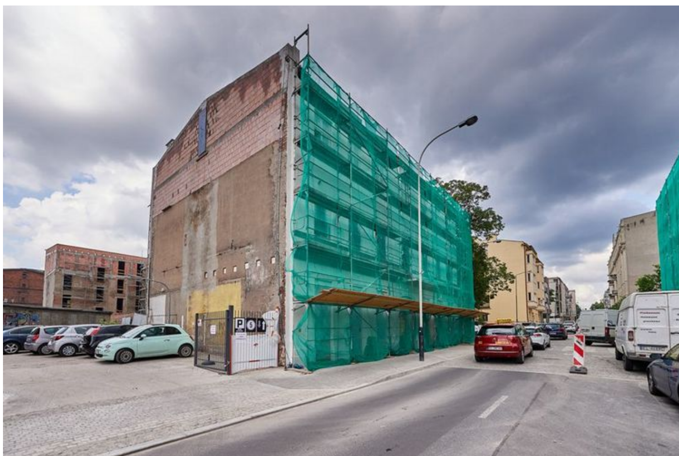
Trwa intensywny remont i przebudowa budynków przy ulicy Sienkiewicza 79.

Trwa intensywny remont i przebudowa budynków przy ulicy Sienkiewicza 79. Inwestycja zostanie zakończona pod koniec tego roku.