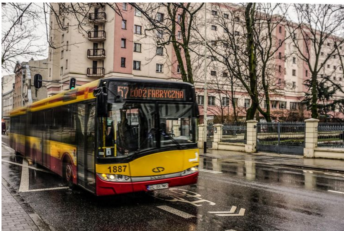
Od stycznia nowe przystanki "na żądanie"

Przystanki na żądanie sprawdziły się na pierwszych pilotażowych liniach. Zatem w nowym roku kolejne pojawią się na liniach 51, 61 i 66.