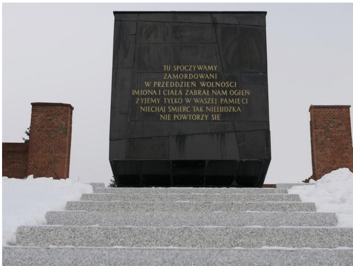
Zakończył się remont pomnika-mauzoleum w Muzeum Tradycji Niepodległościowych w Łodzi na Radogoszczu

74 lata po radogoskiej masakrze teren pomnika - mauzoleum poddano kompleksowej renowacji. 19 stycznia odbędzie się tam uroczystość 74. rocznicy spalenia więźniów Radogoszcza i zakończenia okupacji niemieckiej w Łodzi.