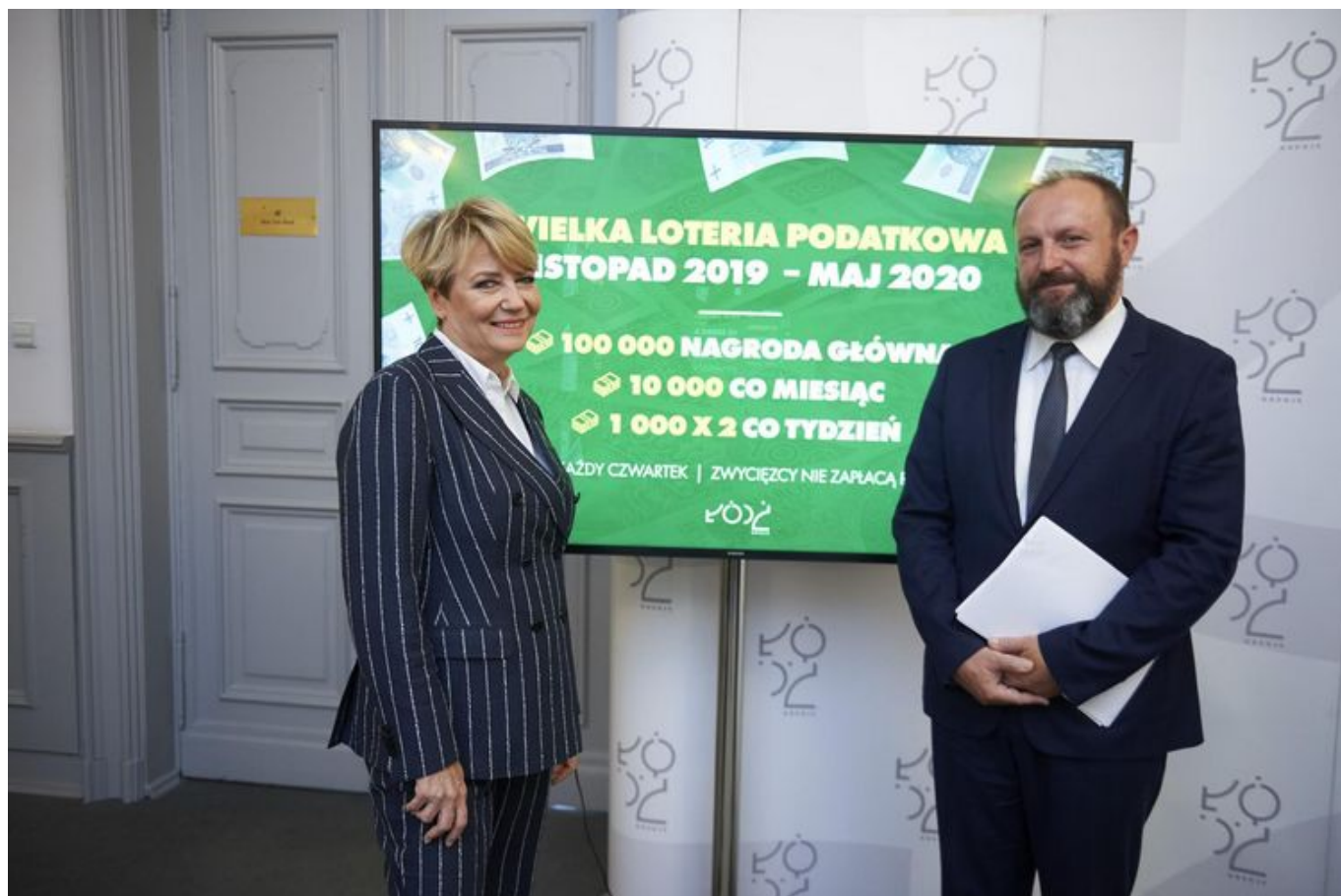
Ponad 220 tysięcy złotych do wygrania w łódzkiej loterii podatkowej , fot. Radosław Józwiak / UMŁ

Ponad 220 tysięcy złotych będzie można wygrać podczas pierwszej w historii Łodzi loterii podatkowej, rozpoczynającej się pod koniec listopada 2019 i trwającej do maja 2020. Udział w niej będą mogli wziąć tylko nowi podatnicy, czyli tacy, którzy do tej pory rozliczali się z podatku dochodowego w innych gminach. W pierwszej kolejności trzeba będzie wypełnić prosty formularz ZAP3 i złożyć go, w dowolnie wybranym urzędzie skarbowym, a następnie zgłosić się do udziału w losowaniu.