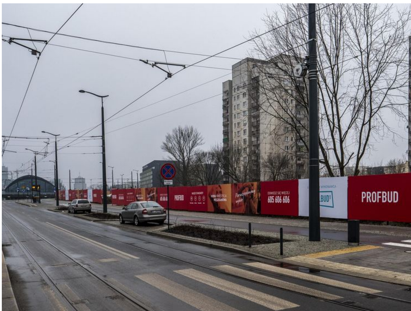
Nowe Centrum Łodzi połączy funkcje biznesowe, mieszkaniowe i kulturalne

Budowa pierwszego budynku mieszkalnego na rogu ulic Węglowej i Tramwajowej rozpocznie się w I kwartale tego roku. Ma być w nim 420 mieszkań.