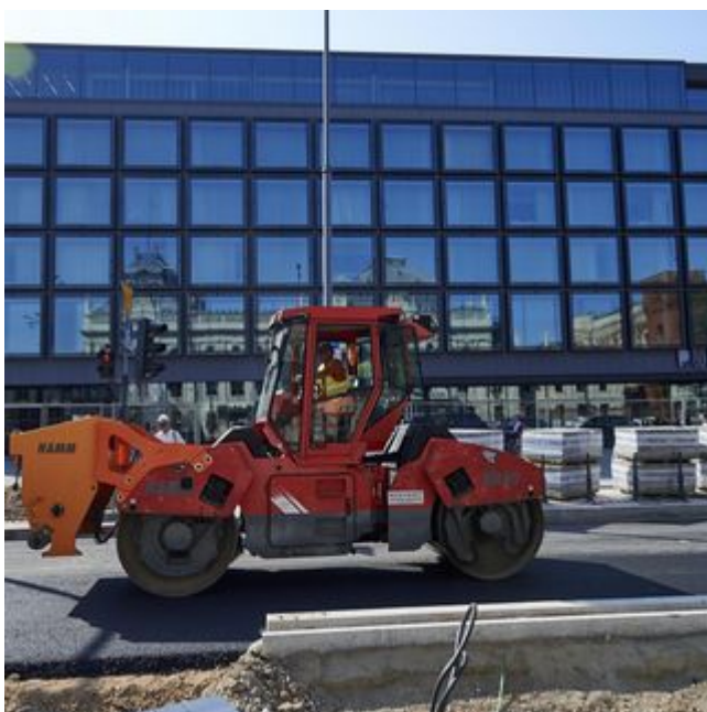
Przebudowa ulicy Ogrodowej na półmetku