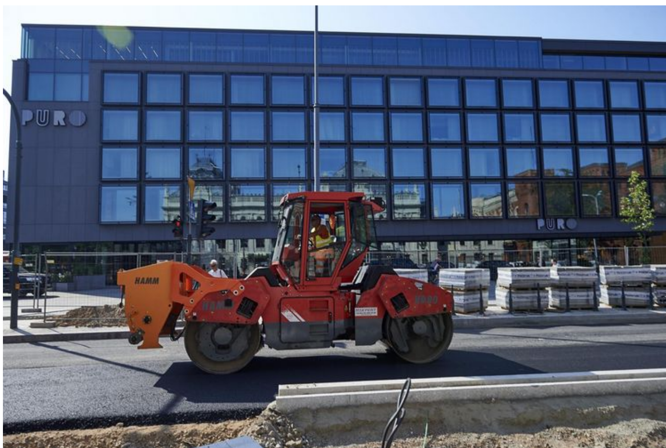
Przebudowa ulicy Ogrodowej na półmetku

Ulica Ogrodowa na półmetku. Układamy asfalt i rozpoczynamy prace po drugiej stronie jezdni. Przebudowany zostanie także cały sąsiadujący z nią kwartał, w którym powstaną pasáže dla pieszych i rowerzystów.