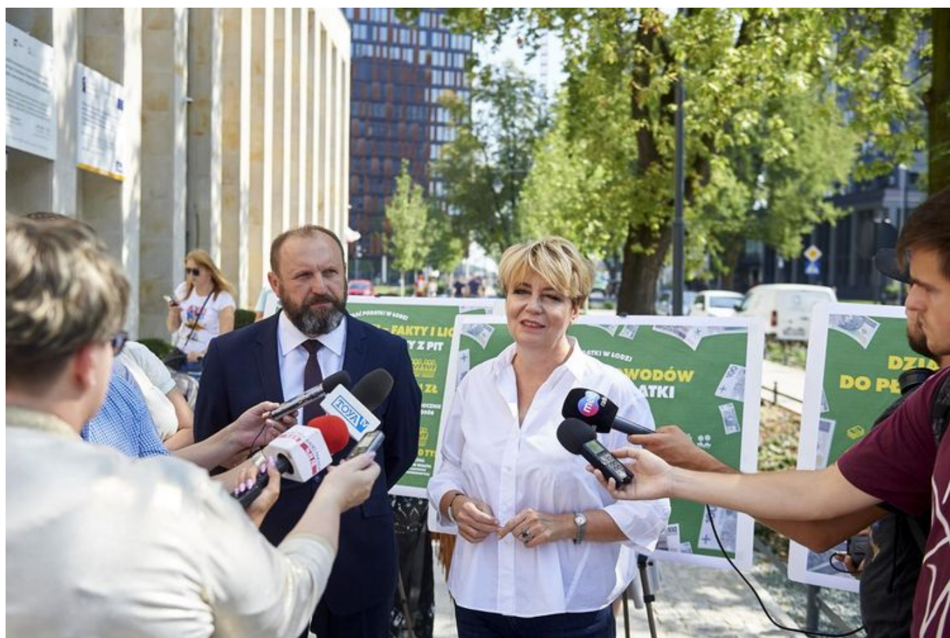
Jesienią rozpocznie się wielka kampania zachęcająca do rozliczania podatków w Łodzi

Chcesz, żeby Łódź jeszcze więcej inwestowała w budowę dróg i ścieżek rowerowych? Albo przeznaczala dodatkowe pieniądze na ochronę zdrowia, oświatę czy bezpieczeństwo? Możesz mieć na to wpływ. Wystarczy, że zapłacisz podatek w swoim miejscu zamieszkania. Przekazując swój PIT do Łodzi masz realny wpływ na jej rozwój.