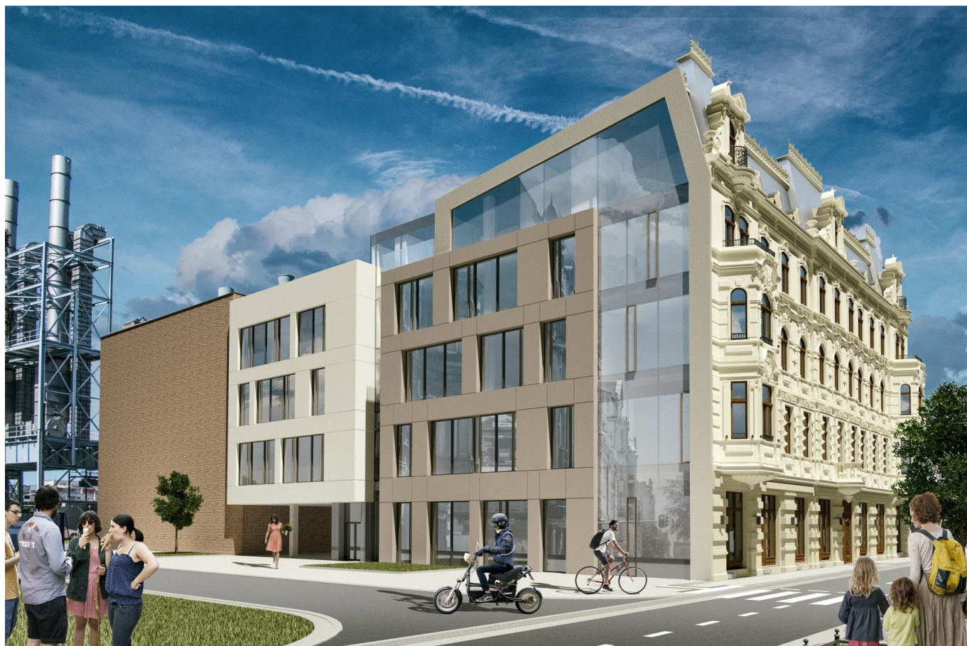
Tuwima 46 - wizualizacja (projekt wykonawczy)

Kompleks przyłączony zostanie do instalacji centralnego ogrzewania. Na zewnątrz budynku urządzony zostanie ogólnodostępny dziedziniec, na którym zasadzonych zostanie 6 drzew. W nowo wybudowanej części powstanie zewnętrzny taras biblioteki o funkcji rekreacyjnej.