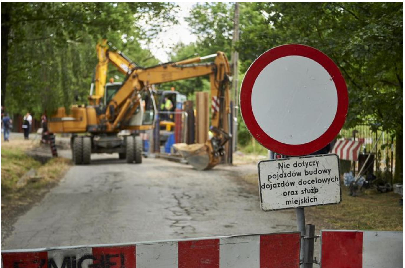
Remont na Złotnie. Kanalizacja, nowe jezdnie, chodniki i oświetlenie

We wtorek, 2 lipca zaczął się wielki remont na Złotnie. To największa inwestycja rozwojowa ŁSI w tym roku. Ulica Podchorążych zyska nową jezdnię, chodniki i oświetlenie.