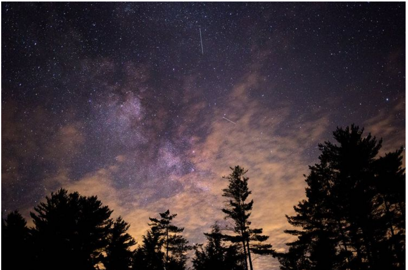
Perseidy najlepiej obserwować z terenów podmiejskich

Jeśli pogoda dopisze to w nocy z 12 na 13 sierpnia zobaczymy w Łodzi dziesiątki spadających gwiazd. Właśnie tej nocy przypada maksimum roju Perseidów 2017. Oto, gdzie i jak obserwować spadające gwiazdy w Łodzi.