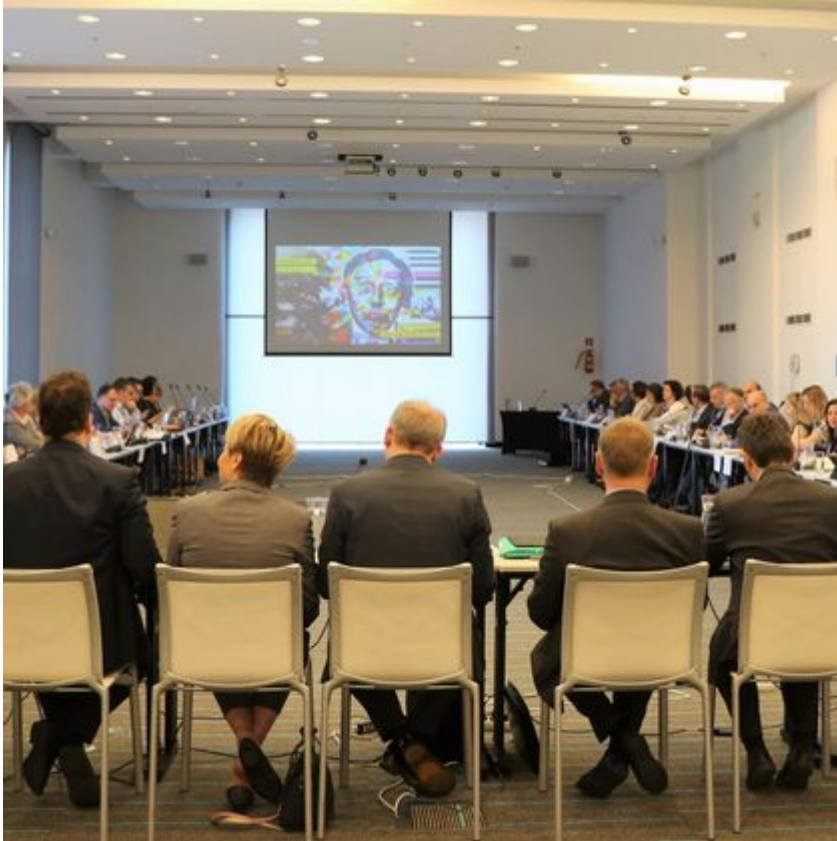
Stanowisko do obserwacji gwiazd