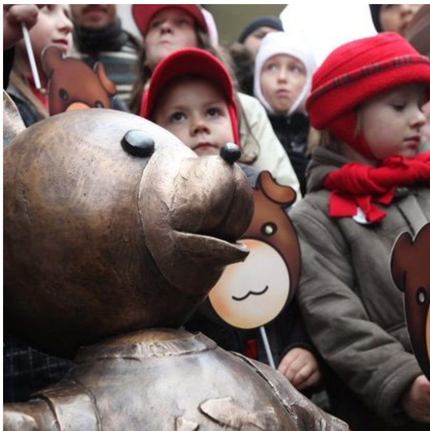
Noc spadających gwiazd w parku Źródlika

Planetarium i Obserwatorium Astronomicznego w Łodzi swoimi opowieściami i fachowymi komentarzami stworzą atmosferę tajemniczości i fascynacji gwiazdami. I tylko wtedy spełnią się wszystkim życzenia i te małe i te duże. Trzeba tylko w to mocno wierzyć.