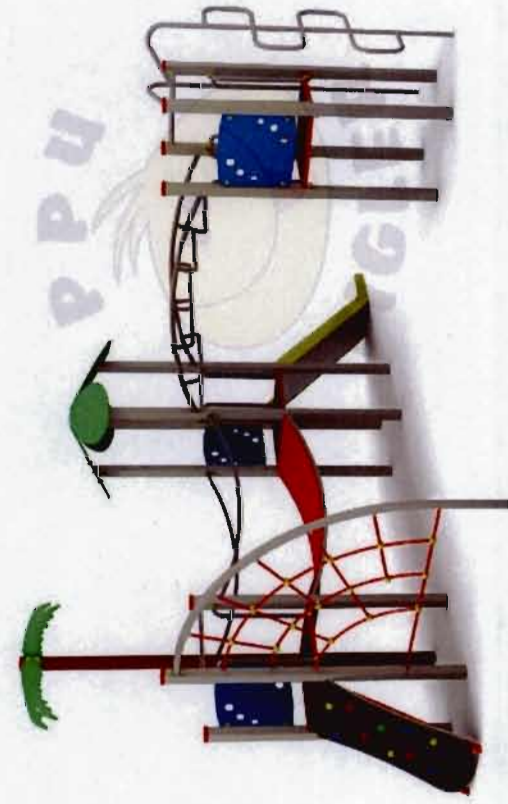
Płaskownica 250x250 cm z siedziskami