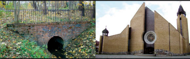
Zimna Woda, ul. Szczecińska