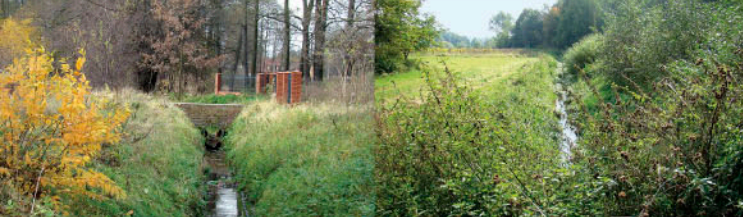
Zimna Woda, ul. Tarczna