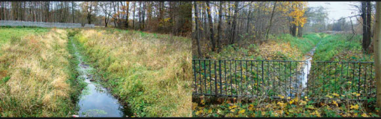
Zimna Woda, ul. Kalinowa