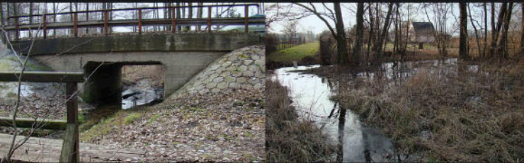
Bzura, most przy ul. Łagiewnickiej Bzura