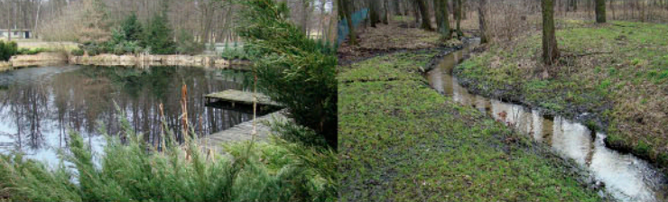
Bzura, ul. Rogowska staw przy Dworku Bzura przy ul. Przepiórczej