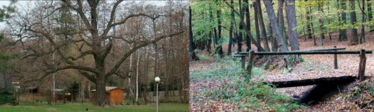
Pomnikowy dąb nad Bzurą, ul. Boruty Łagiewniczanka