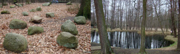
Bzura, glazowisko w Arturówku Bzura, staw przy ul. Boruty