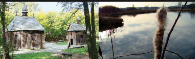
Łagiewniki, kapliczki Łagiewniki, staw przy ul. Okólnej