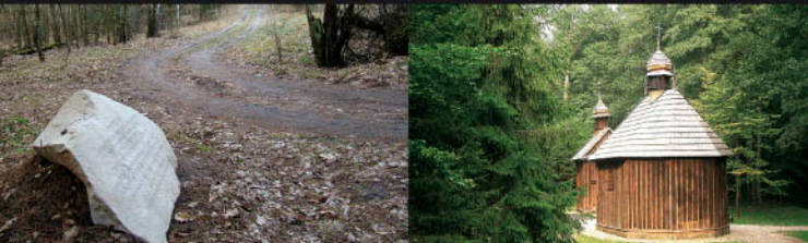
Łagiewniki, miejsce zbrodni z 1939 r. Łagiewniki, szlak kulturowy