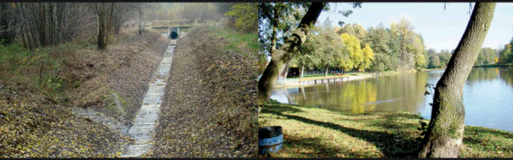
Olechówka, odcinek źródłowy