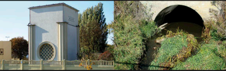
Chojny, studnia głębinowa