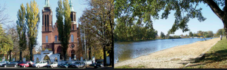
Chojny, kościół św. Wojciecha