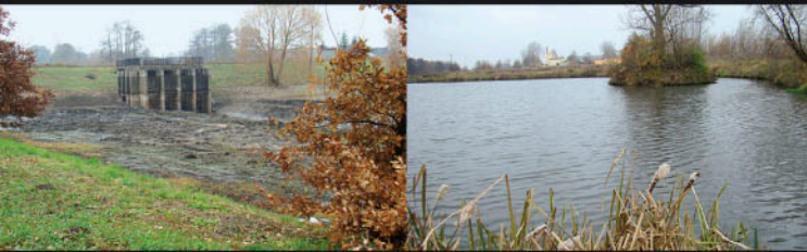
Staw przy ul. Olechowskiej