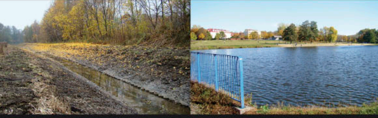
Olechówka, odcinek źródłowy