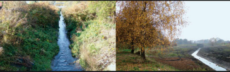
Olechówka, ul. Przyrzeczna