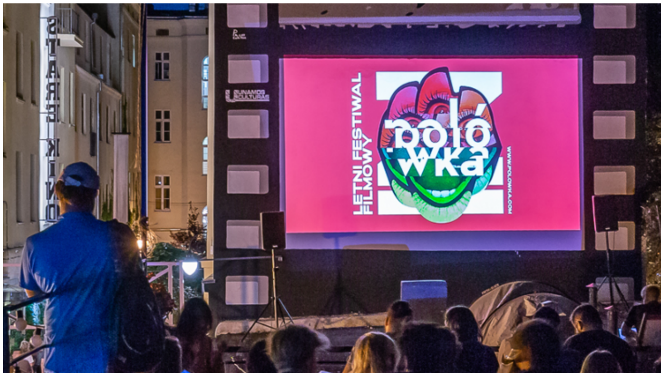
Grafika promująca wydarzenie: 12. LFF - Polówka 2019 | Hotel Cinema Residence [niedziele - Repertuar]

TME - łódzka firma, będąca globalnym dystrybutorem komponentów elektronicznych, została sponsorem tytularnym Polówki i będzie nas wspierać przez trzy kolejne edycje festiwalu - wielkie dzięki! W tym roku pożegnaliśmy się z niektórymi miejscami, ale dołączają też zupełnie nowe, gdzie polówkowa noga jeszcze nigdy nie stanęła. Jesteśmy ciekawi, jak Wam się spodobają. Nasz tegoroczny program to prawdziwa petarda! Gramy różnorodnie i ciekawie. TME Polówka odbywa się dzięki wsparciu Urzędu Miasta Łodzi oraz sponsorów, partnerów i patronów medialnych - serdeczne dzięki za wsparcie jakiego nam udzielacie! Do zobaczenia na seansach, codziennie po zmroku, czyli po 21:00!