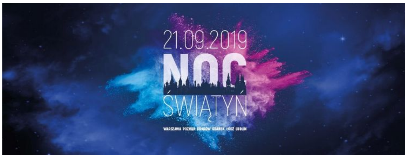
Grafika promująca wydarzenie: 3. edycja Nocy Świątyń w Łodzi

Zapraszamy do udziału w 3. edycji Nocy Świątyń w Łodzi! To wydarzenie edukacyjne, które ma na celu ukazanie Łodzi, jako miasta wielokulturowego, różnorodnego i otwartego, a także adresowane do wszystkich, którzy chcą poznać różne religie i wyznania. Tegoroczna edycja to dobra okazja do odwiedzenia ponad 50 niezwykłych budowli i miejsc kultu w 6 polskich miastach! Organizatorem łódzkiej edycji jest Centrum Dialogu im. Marka Edelmana. Wstęp bezpłatny.