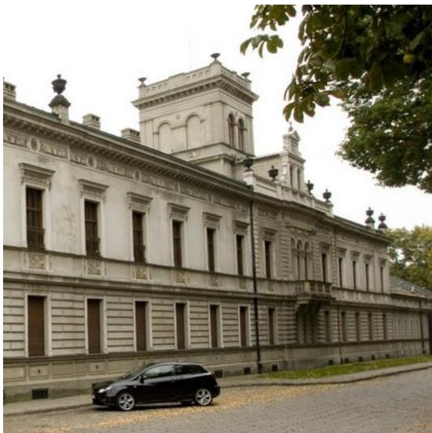
Pałace w Łodzi