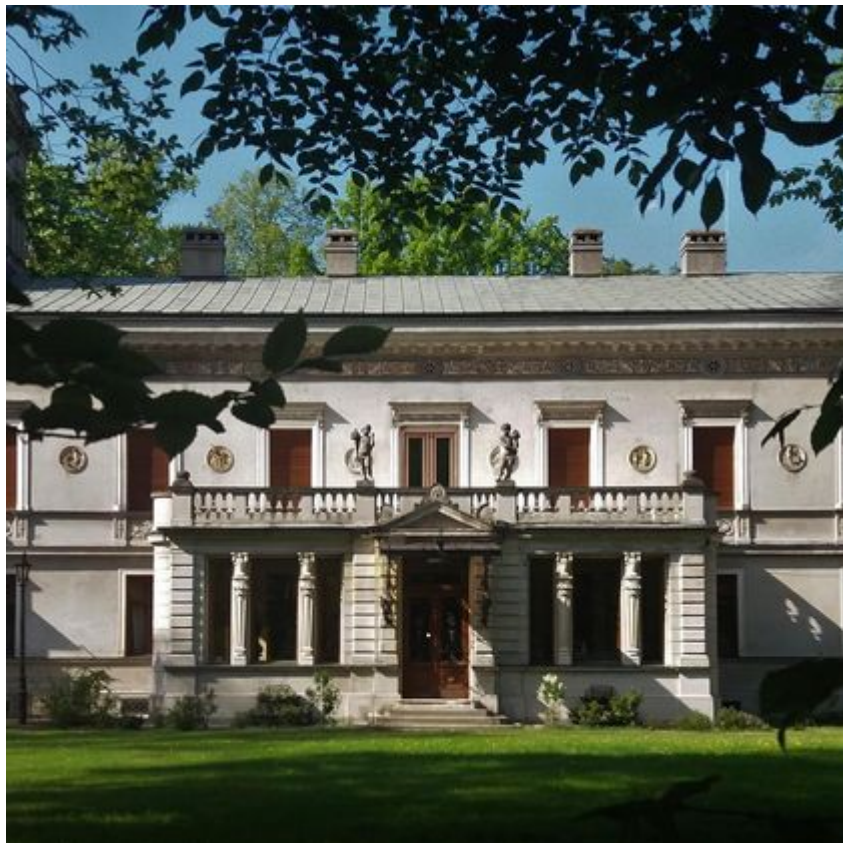
Muzeum Kinematografii w Łodzi