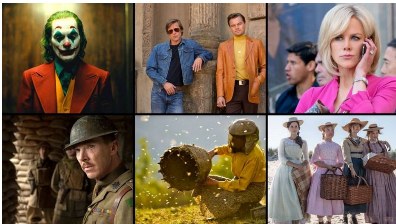
Grafika promująca wydarzenie: Oscarowy repertuar | projekcje w Kinie Kinematograf w Muzeum Kinematografii

W lutym w kinie Kinematograf pokażemy wszystkie tytuły nominowane do Oscara w kategorii: „Najlepszy film” oraz „Film międzynarodowy”.