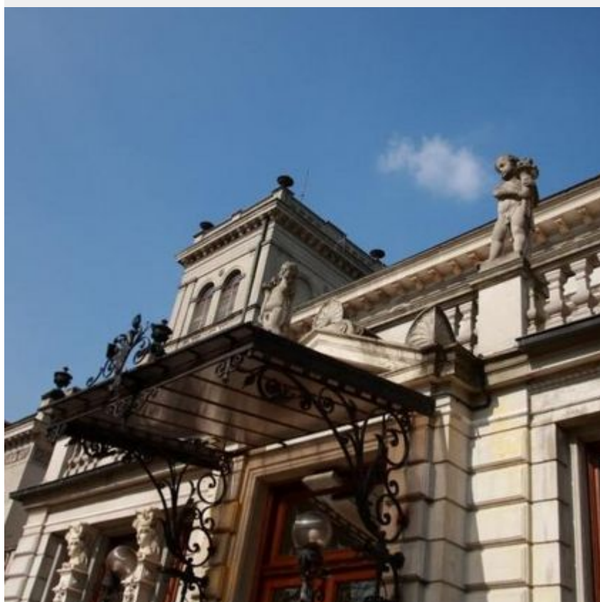
Pałace w Łodzi