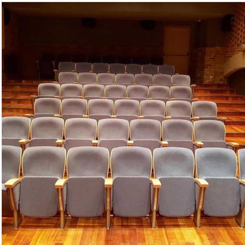
Muzeum Kinematografii w Łodzi