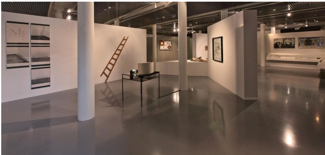
Atlas nowoczesności. Kolekcja Sztuki XX i XXI wieku. Wystawa w Muzeum Sztuki w Łodzi (ms2), widok ekspozycji

Kolekcję udostępniono publiczności po raz pierwszy w lutym 1931 r. w pierwotnej siedzibie muzeum w ratuszu przy Placu Wolności 1. Zbiory grupy „a.r.” gromadzone były w latach 1929–32 i uzupełniane do 1938 roku. Inicjatorem i głównym animatorem akcji pozyskiwania darów od artystów był malarz i teoretyk sztuki Władysław Strzemiński, aktywnie wspierany przez rzeźbiarkę Katarzynę Kobro, malarza Henryka Stażewskiego oraz poetów Jana Brzękowskiego i Juliana Przybosa. Zebrana Kolekcja w swym wymiarze ideowym stanowi obraz preferencji artystycznych Strzemińskiego, choć jej kształt ostateczny jest wypadkową działań wielu osób, w tym Henryka Stażewskiego, Hansa Arpa i Michela Seuphora.