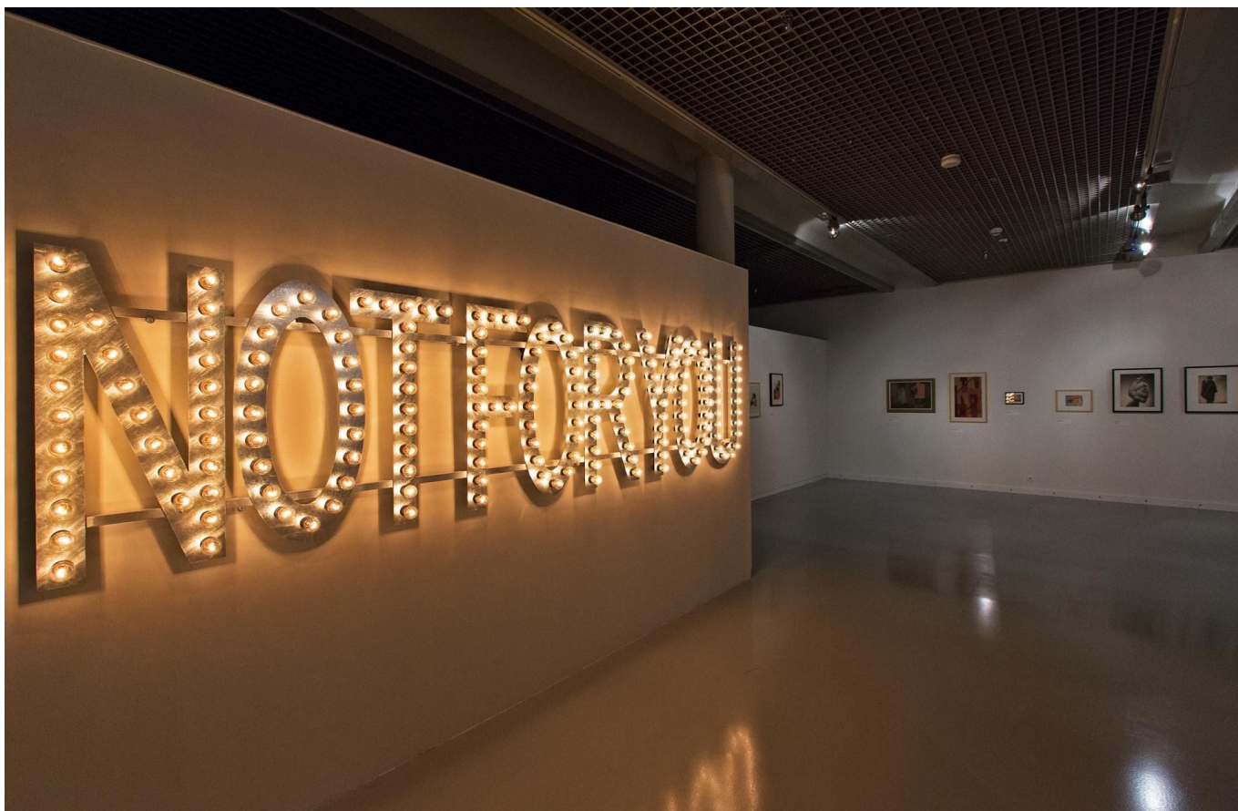
Atlas nowoczesności. Kolekcja Sztuki XX i XXI wieku. Wystawa w Muzeum Sztuki w Łodzi (ms2), widok ekspozycji, fot. P. Tomczyk/ mat. pras. Muzeum Sztuki w Łodzi

Shibli, Mladena Stilinovića, Mony Vătămanu & Florin Tudor, Haegue Yang, Konrada Smoleńskiego, Cezarego Bodzianowskiego, Liama Gillicka, Zbigniewa Libery, Artura Żmijewskiego, Julity Wójcik, Antje Majewski czy Allana Sekuly, a także obiekty i druki ulotne pochodzące z archiwum Muzeum, m. in. scenopis rysunkowy do filmu „Jan Matejko” Andrzeja Wajdy.