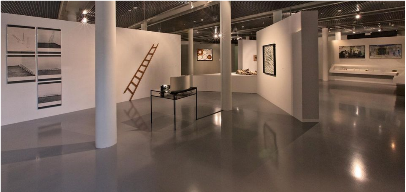
Atlas nowoczesności. Kolekcja Sztuki XX i XXI wieku. Wystawa w Muzeum Sztuki w Łodzi (ms2), widok ekspozycji

Kolekcję udostępniono publiczności po raz pierwszy w lutym 1931 r. w pierwotnej siedzibie muzeum w ratuszu przy Placu Wolności 1. Zbiory grupy „a.r.” gromadzone były w latach 1929–32 i uzupełniane do 1938 roku. Inicjatorem i głównym animatorem akcji pozyskiwania darów od artystów był malarz i teoretyk sztuki Władysław Strzemiński, aktywnie wspierany przez rzeźbiarkę Katarzynę Kobro, malarza Henryka Stażewskiego oraz poetów Jana Brzękowskiego i Juliana Przybosa. Zebrana Kolekcja w swym wymiarze ideowym stanowi obraz preferencji artystycznych Strzemińskiego, choć jej kształt ostateczny jest wypadkową działań wielu osób, w tym Henryka Stażewskiego, Hansa Arpa i Michela Seuphora.