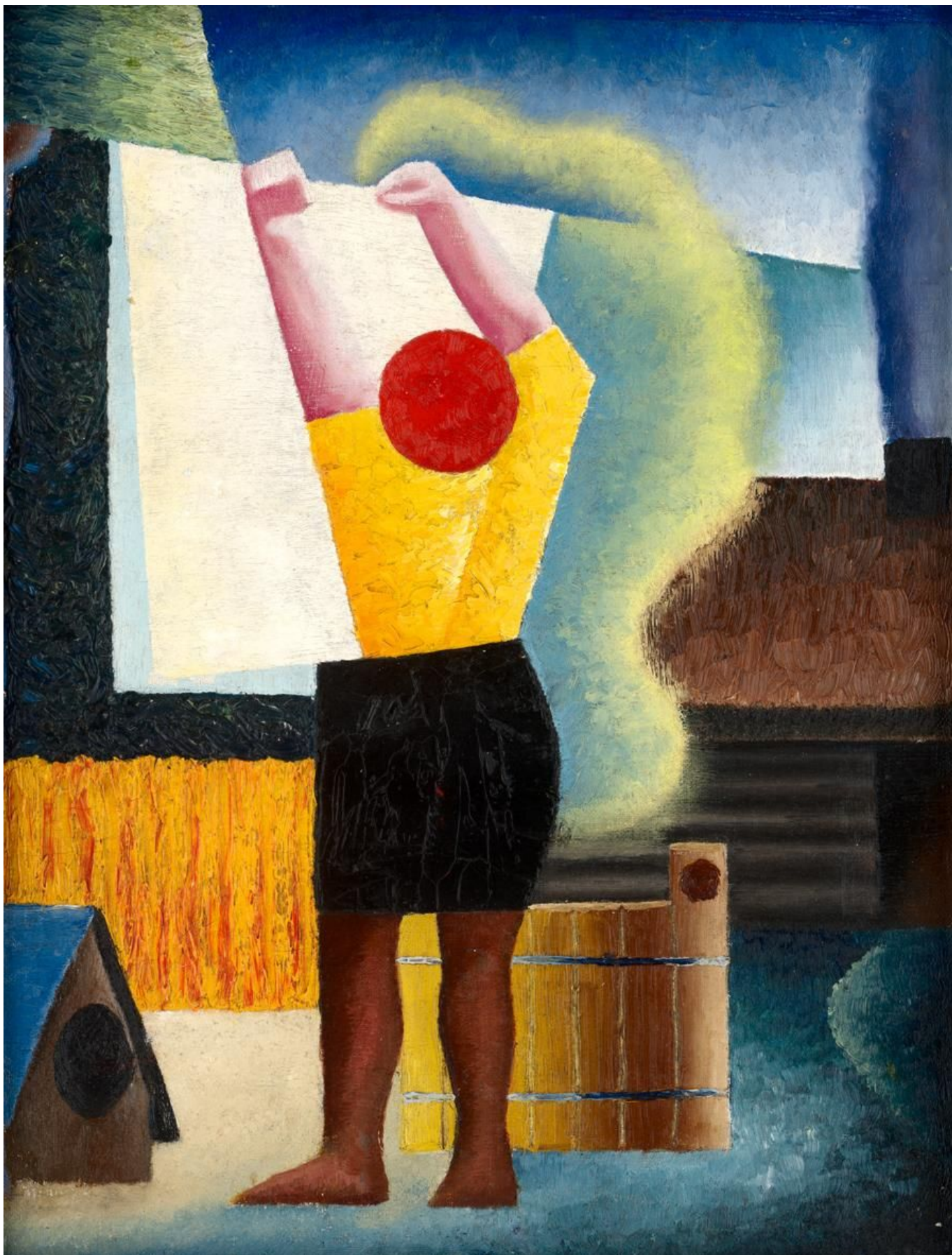
Vladas Drėma Pracznia, 1930, olej, płótno, Lietuvos Dailės Muziejus, Wilno