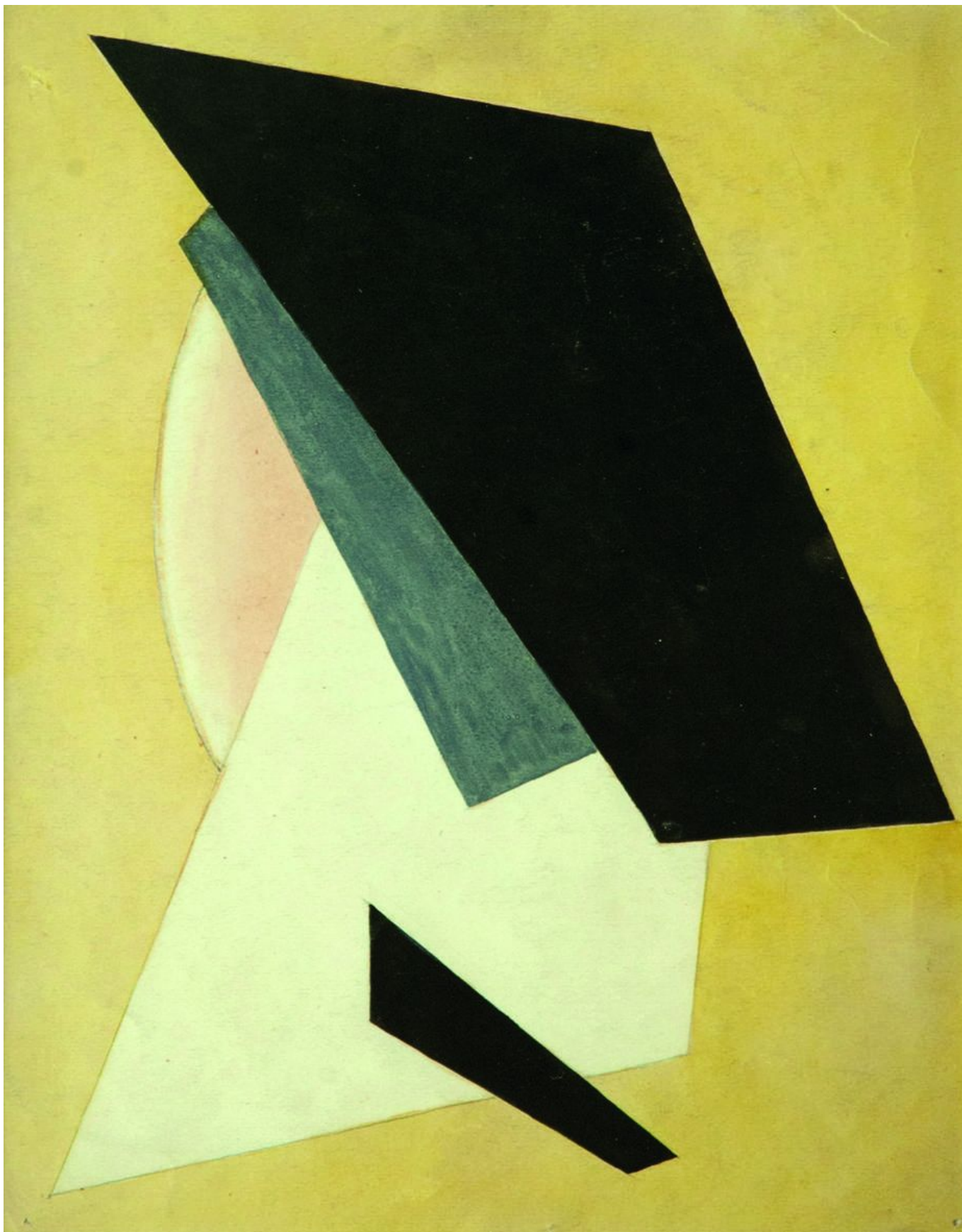
Lubow Popova, Kompozycja, 1910-1911, gwasz, papier, Mystetskyi Arsenal, Kijów