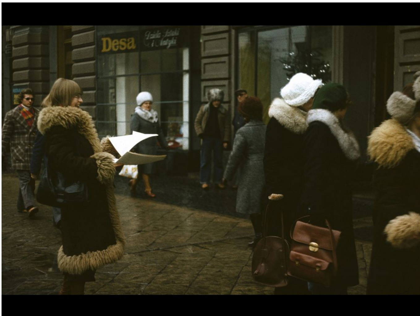
Galeria Sztuki Najnowszej, Przyłączcie się do naszego protestu przeciwko produkcji bomby neutronowej 1977, CC Lech Mrozek, fot. mat. Muzeum Sztuki w Łodzi

Wystawa zaprezentuje ten zmieniający się stosunek twórców awangardy do państwa w okresie II Rzeczypospolitej i PRL-u. Przyjęty zakres czasowy pozwoli śledzić i porównywać przemieszczanie się znaczeń w ramach takich wątków, jak zaangażowanie społeczne i lewicowość, suwerenność i niepodległość, wolność sztuki i sytuacja materialna artysty, a w końcu sposób uhistoryczniania przedwojennej awangardy ze względu na funkcjonowanie sztuki w okresie PRL-u.