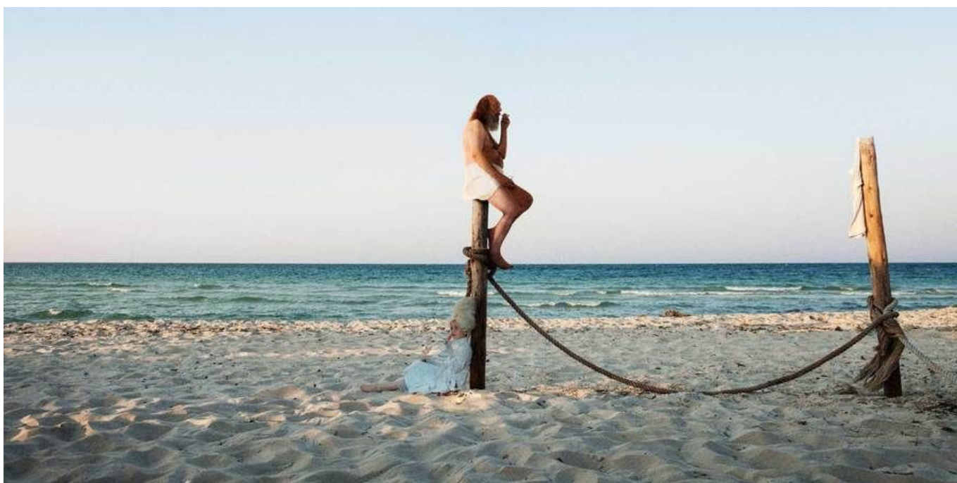
Friedrich Rudolph - fotografia, Tanya Krylova - rzeźba. Wystawa w Ośrodku Propagandy Sztuki (Miejska Galeria Sztuki w Łodzi)

Świat, w który Claus Friedrich Rudolph nas wprowadza, to świat zawieszony między prawdą a fikcją, między widzialną rzeczywistością a jej wyobrażeniem, między życiem a konstrukcją pełną efektownych pozorów. Jest znajomy i obcy zarazem. Wytwory onirycznej barokowej wyobraźni świadomie balansują na granicy glamour, campu i kiczu. Są prowokacyjne i dekadentkie. Wchodzą w grę z wzniosłymi estetykami formuł reklamowych. Prowadzą dyskurs z duchem naszych czasów.