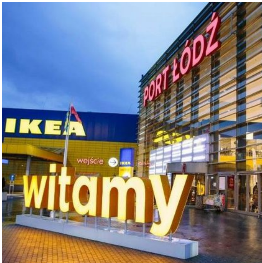
Centrum Handlowe Port Łódź