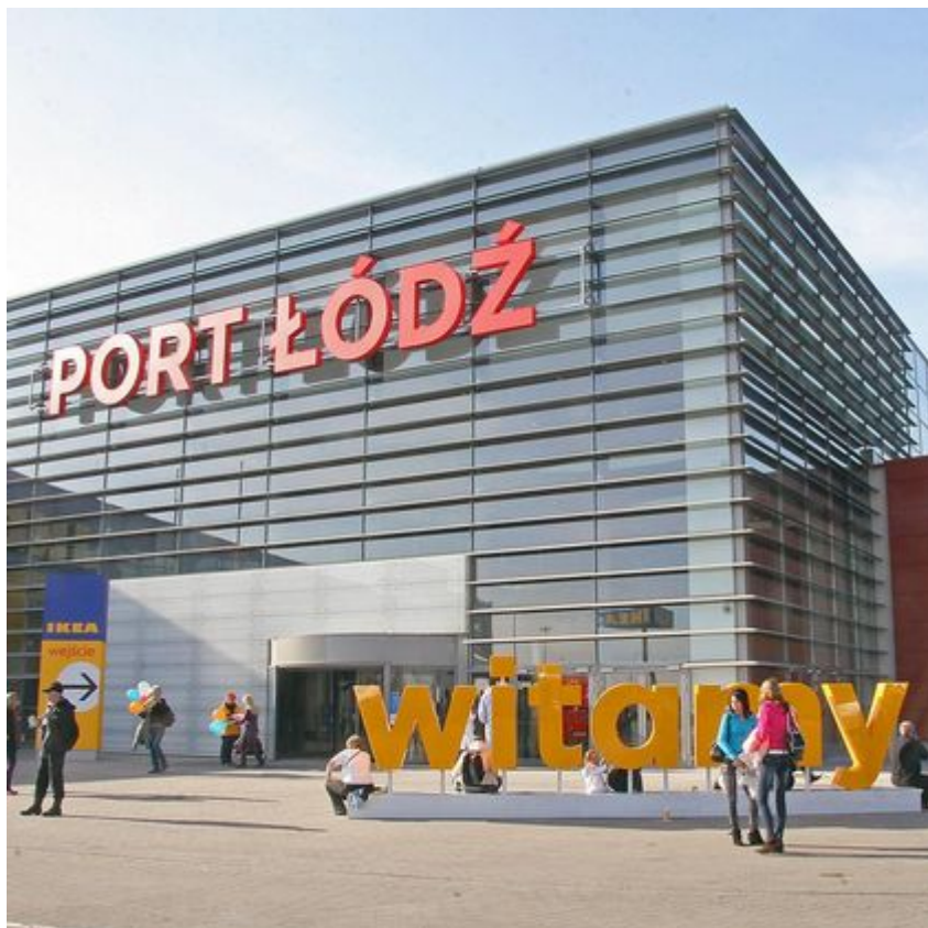
Centrum Handlowe Port Łódź