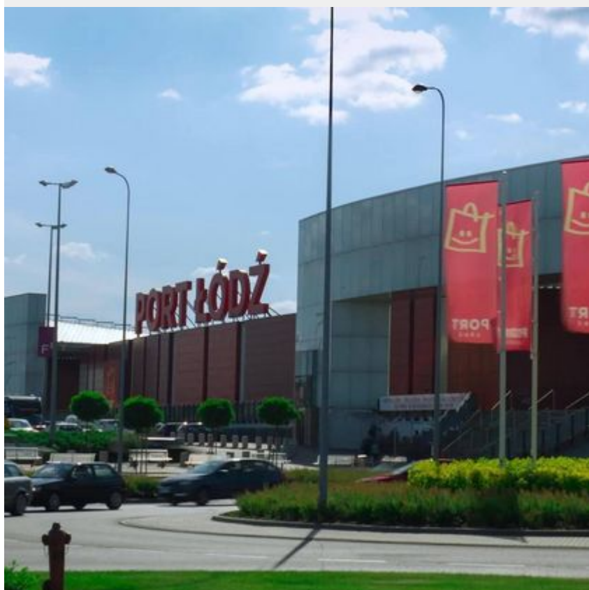
Centrum Handlowe Port Łódź