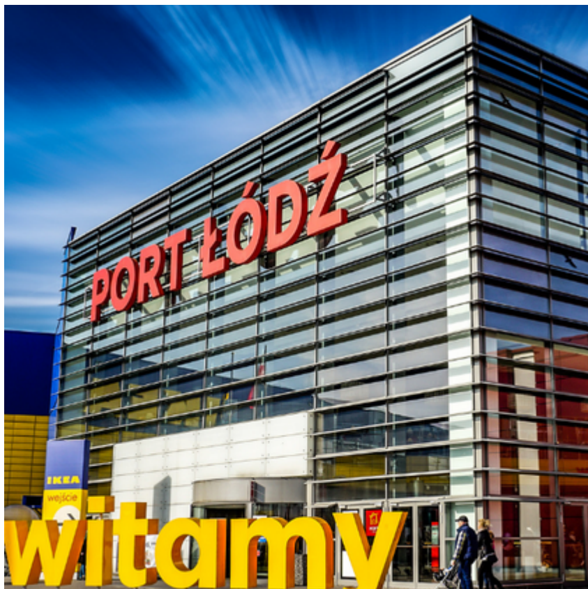
Centrum Handlowe Port Łódź