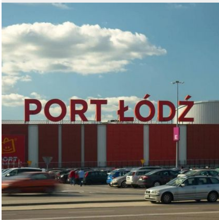
Centrum Handlowe Port Łódź