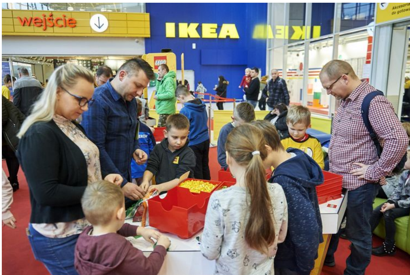
Zdjęcie promujące wydarzenie: Ferie z Portem Łódź: wielka zabawa Lego! w Porcie Łódź

Tegoroczne ferie w Porcie Łódź będą szczególnie wyjątkowe ponieważ w tym roku obchodzimy nasze 10-te urodziny! W związku z tym przez dwa tygodnie budować będziemy wspólnie ogromny jubileuszowy tort, oczywiście cały z klocków LEGO!