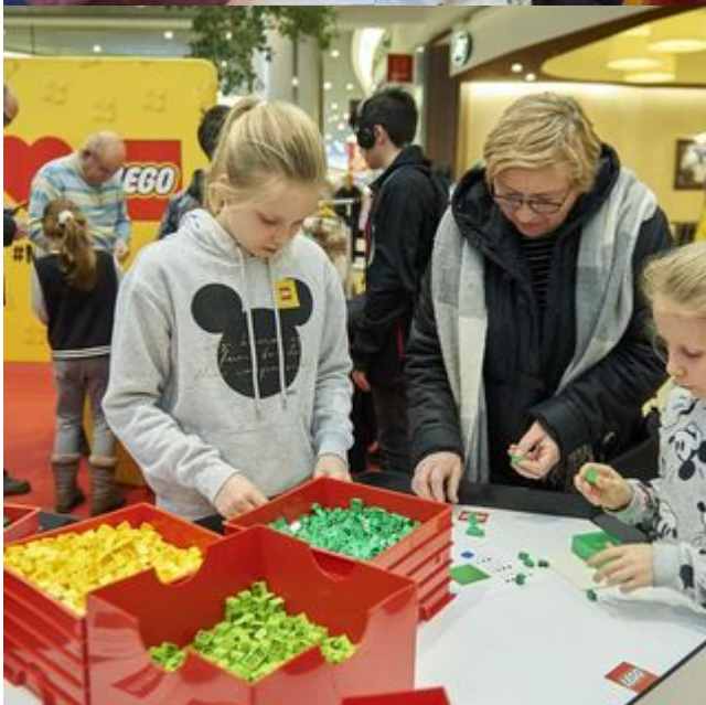
Ferie z Portem Łódź: wielka zabawa Lego! w Porcie Łódź