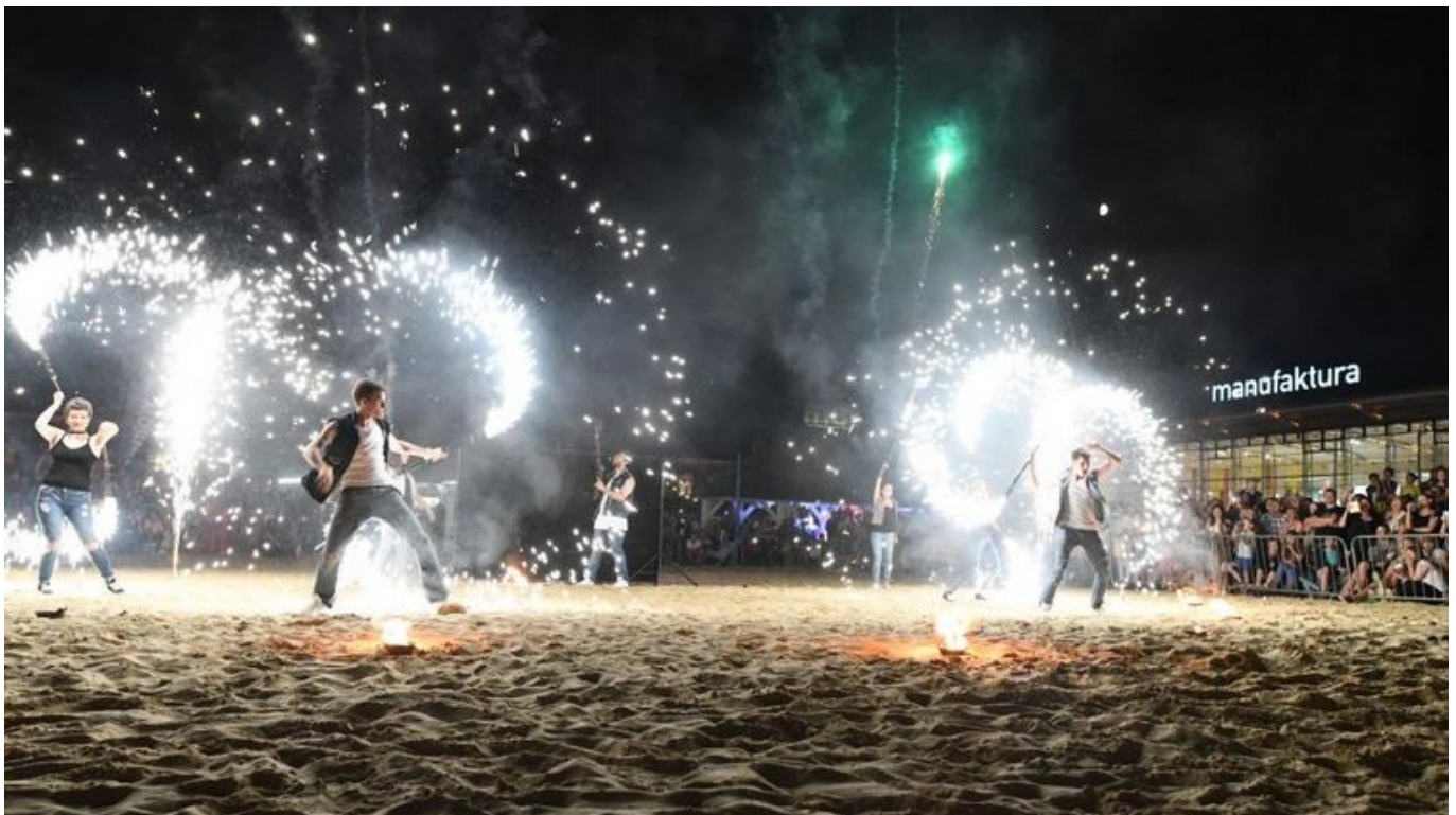
Zdjęcie promujące wydarzenie: 7. Festiwal Ognia na plaży w Manufakturze

W sobotę 20 lipca, plaża Manufaktury zapłonie za sprawą teatrów ognia z całej Polski. Już po raz siódmy odbędzie się tu Festiwal Ognia - soliści i grupy teatralne zaprezentują niepowtarzalny, ognisty, zapierający dech w piersiach spektakl.