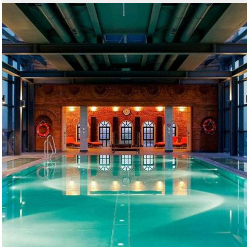
Hotel Vienna House by Andel's, Łódź