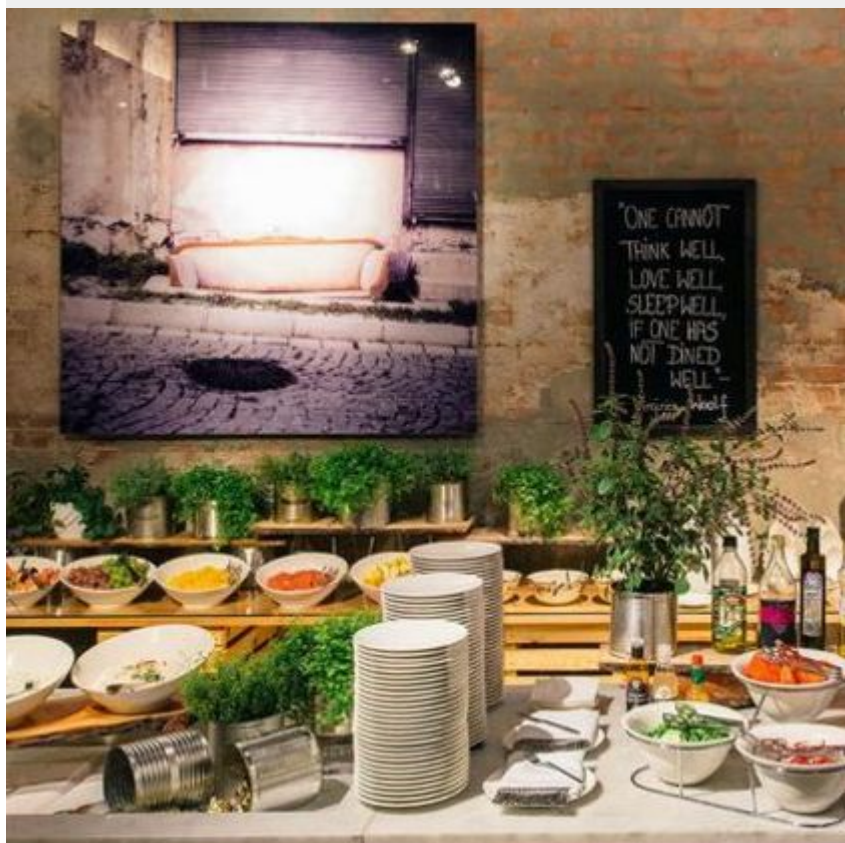
Hotel Vienna House by Andel's, Łódź