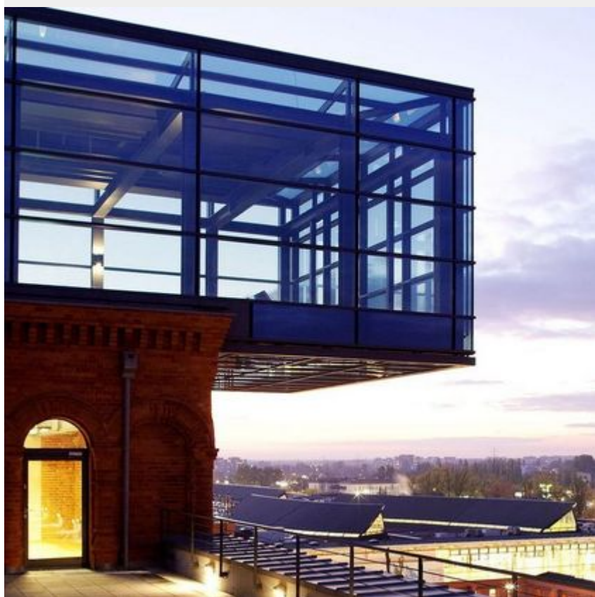
Hotel Vienna House by Andel's, Łódź