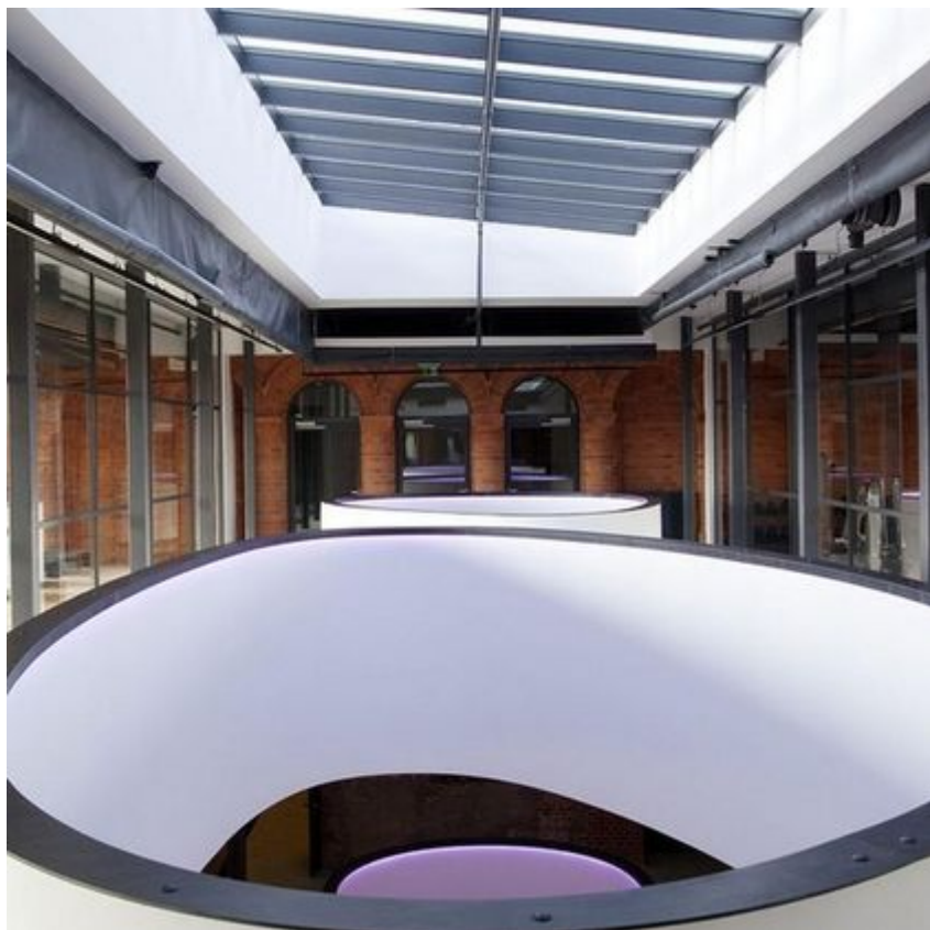
Hotel Vienna House by Andel's, Łódź