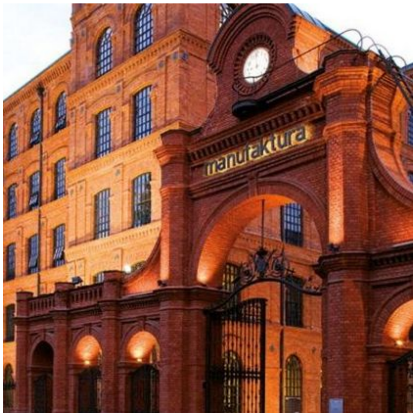
Hotel Vienna House by Andel's, Łódź