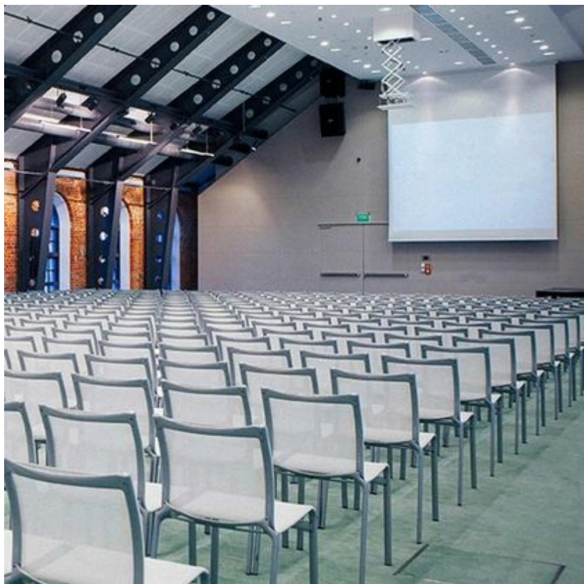
Hotel Vienna House by Andel's, Łódź