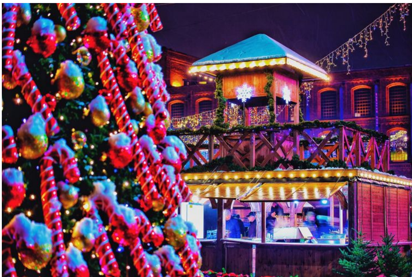
Zdjęcie promujące wydarzenie: "Jarmark Bożonarodzeniowy w Manufakturze"

Odwiedzający znajdą tu znakomite regionalne wyroby i oryginalne pomysły na gwiazdkowe upominki.