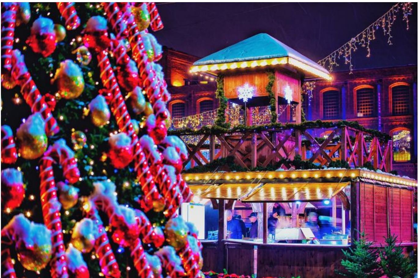
Zdjęcie promujące wydarzenie: "Jarmark Bożonarodzeniowy w Manufakturze"

Odwiedzający znajdą tu znakomite regionalne wyroby i oryginalne pomysły na gwiazdkowe upominki.