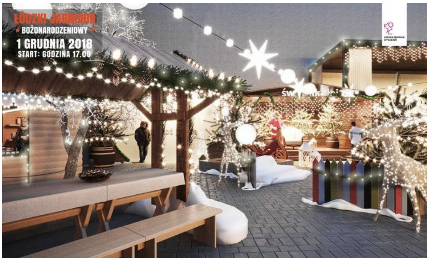
Jarmark Bożonarodzeniowy 2018 na ulicy Piotrkowskiej - wizualizacja