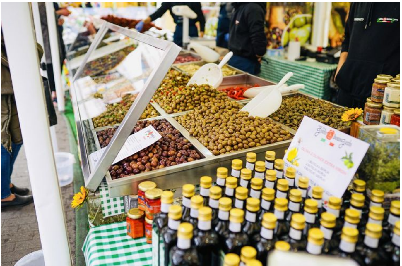
Jarmark "Eccellenze Italiane" na Rynku Manufaktury

Oliwki, wina, oliwy, sery, wędliny, słodczyce i oczywiście makarony to tylko część tego co już niebawem będzie można kupić podczas jarmarku włoskiego na ryku Manufaktury. Od piątku (28.06) jarmark Eccellenze Italiane znowu będzie kusił łodzian smakami i aromatami Italii.