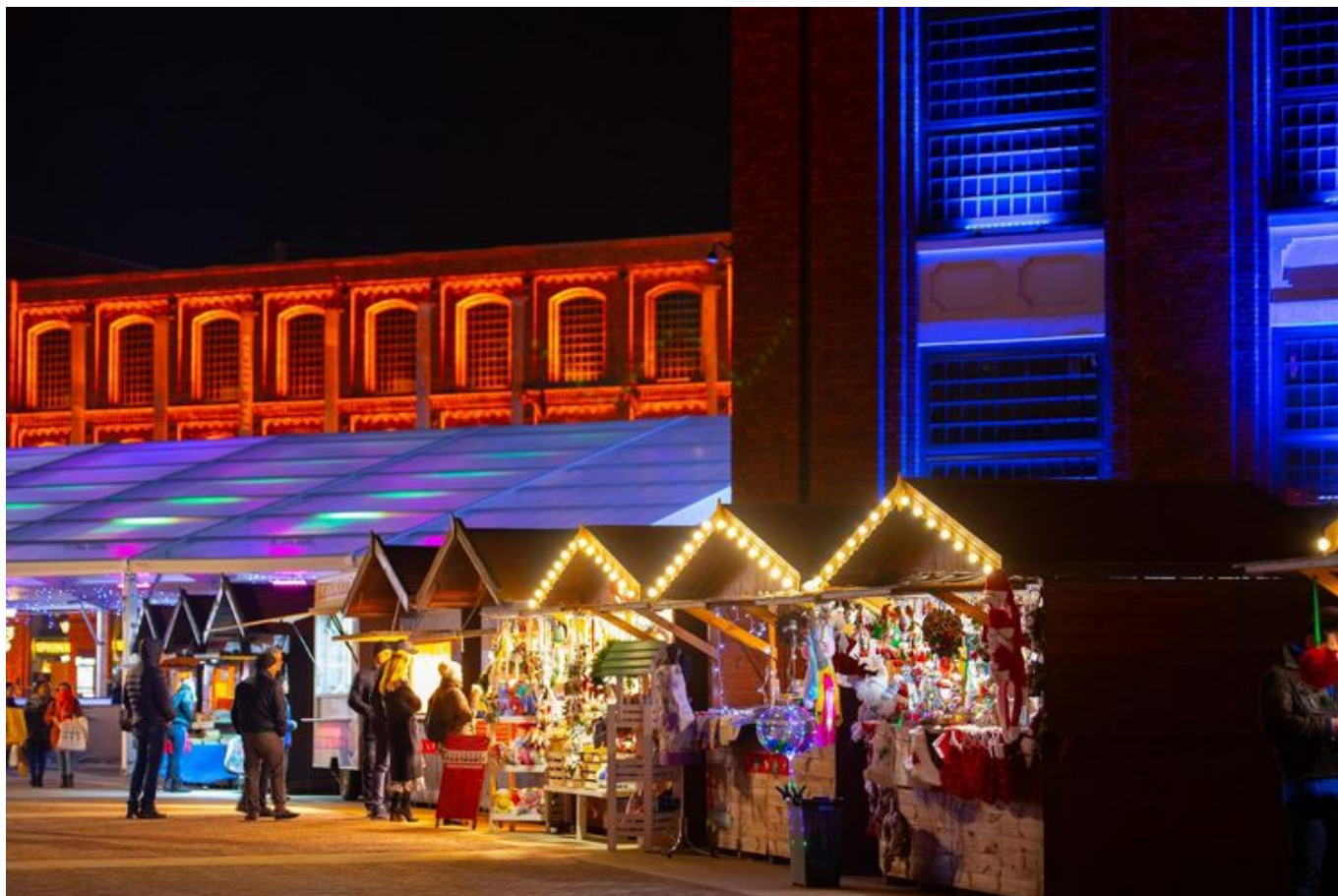
Zdjęcie promujące wydarzenie: Jarmark świąteczny | żywe choinki w Manufakturze , fot. mat. Manufaktura

Jarmark na rynku Manufaktury kusi przysmakami na świąteczny stół. Niektórzy wystawcy są tu co roku: - Mamy w Łodzi stałych klientów. Zawsze przed świętami przychodzą po nasz autorski miód malinowy z propolisem, imbirem i kurkumą. Hitem jest też mniszkowy z cynamonem – mówi przedstawicielka pasieki „Tutaj” z Masłowa Drugiego w Świętokrzyskiem. W bogatej ofercie tej niewielkiej miodowej manufaktury są też m.in. miód faceliowy z pyłkiem kwiatowym, który korzystnie wpływa na układ pokarmowy i wspomaga rekonwalescencję po operacji woreczka żółciowego, a także nawłociowy – niezastąpiony przy zapaleniu gardła.