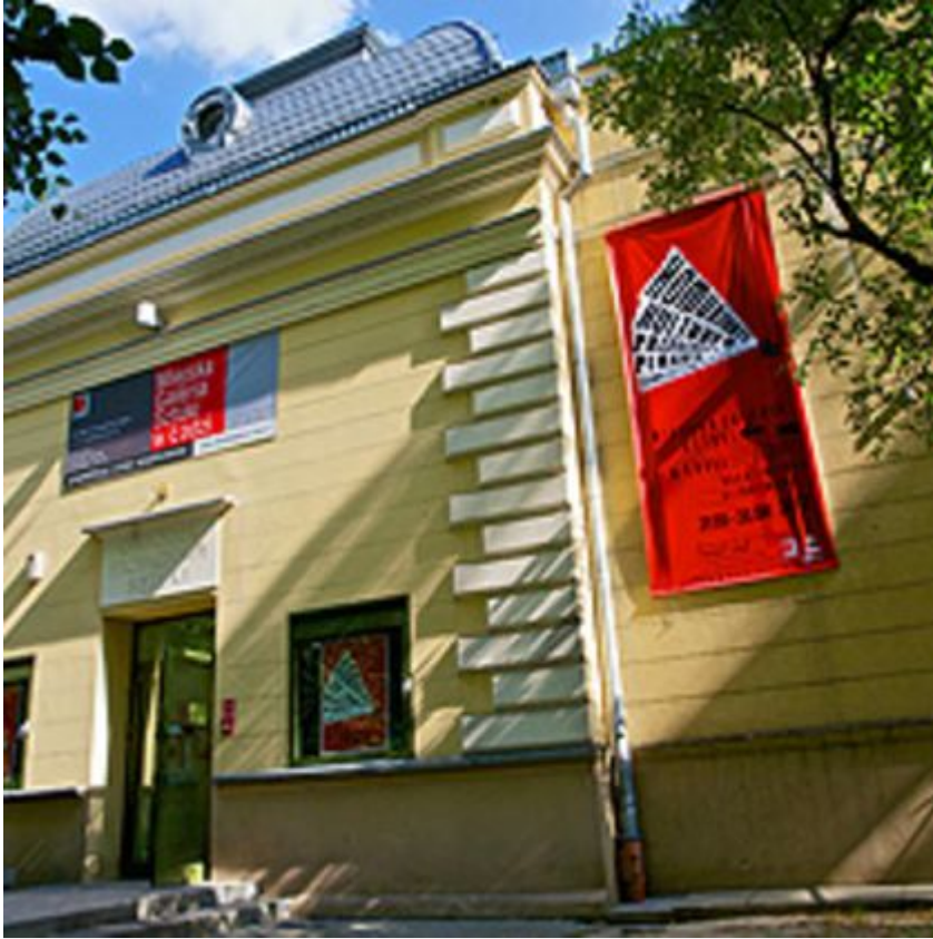
Ośrodek Propagandy Sztuki