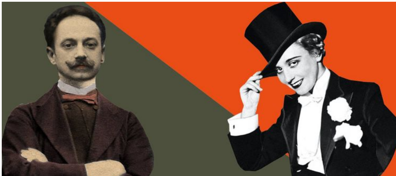
Grafika promująca wydarzenie: „Kino Kresów” i „Kazimierz Prószyński” - wystawy w EC1

Dwie wyjątkowe wystawy, przygotowane przez Narodowe Centrum Kultury Filmowej: „Kino Kresów. Kultura filmowa na ziemiach wschodnich II Rzeczypospolitej” oraz „Kazimierz Prószyński. Wynalazca i wizjoner”.