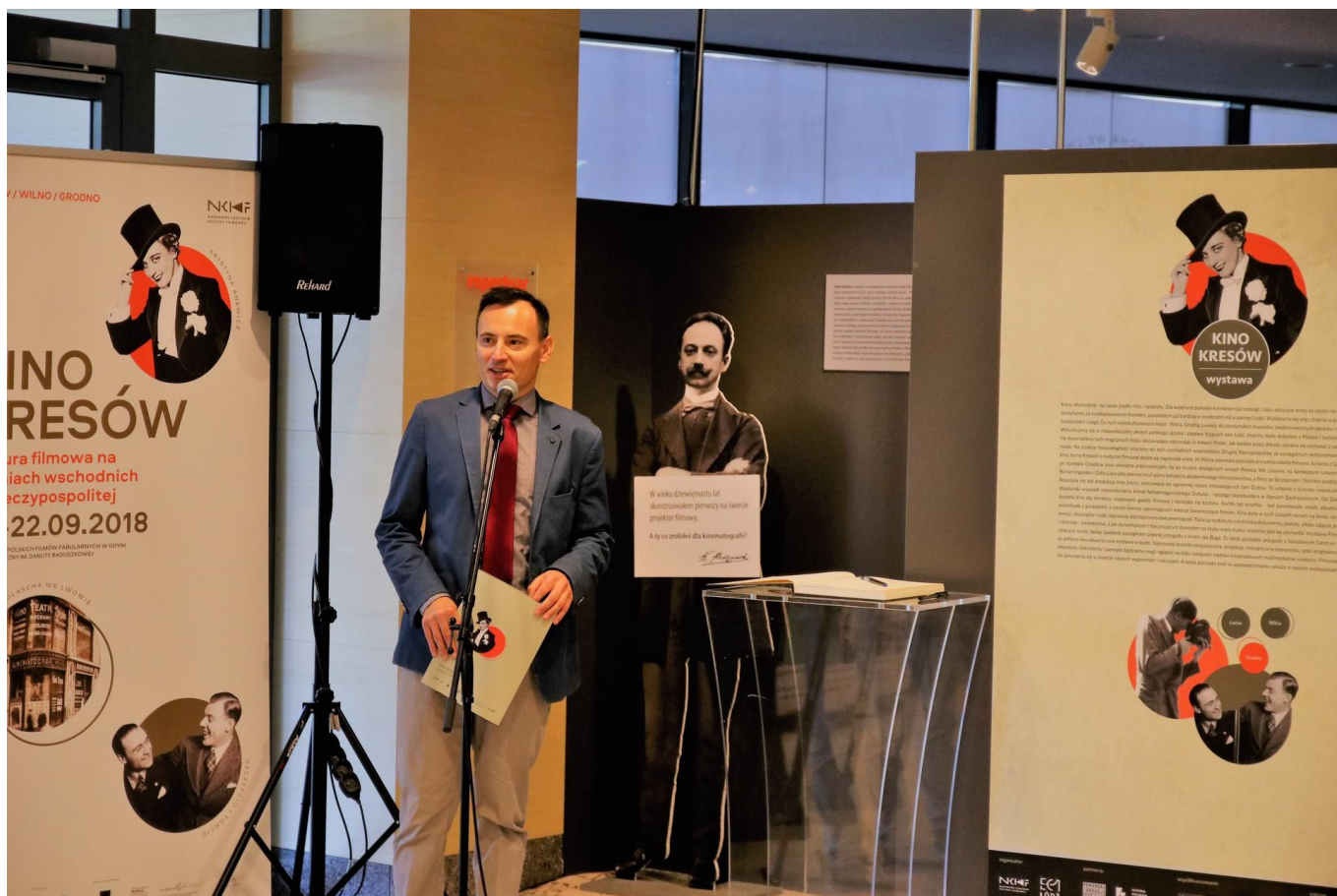
Zdjęcie promujące wydarzenie: "Kino Kresów - kultura filmowa na ziemiach wschodnich II Rzeczypospolitej" - wystawa w EC1