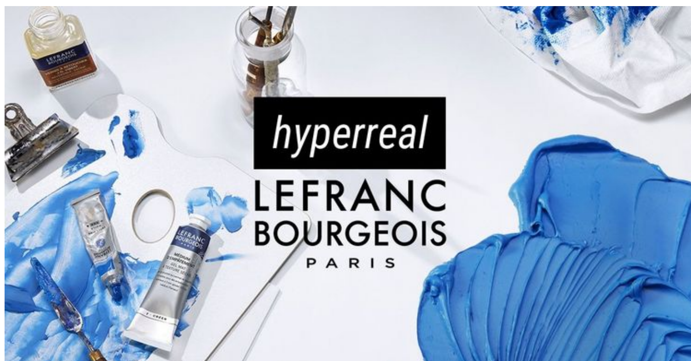
Grafika promująca wydarzenie: Konkurs Hyperreal - konkurs w pracowni artystycznej OKO

Zapraszamy wszystkich artystów do zgłaszania swoich prac do konkursu malarskiego "Hyperreal", który organizujemy, we współpracy z Lefranc Bourgeois - fundatora nagród.