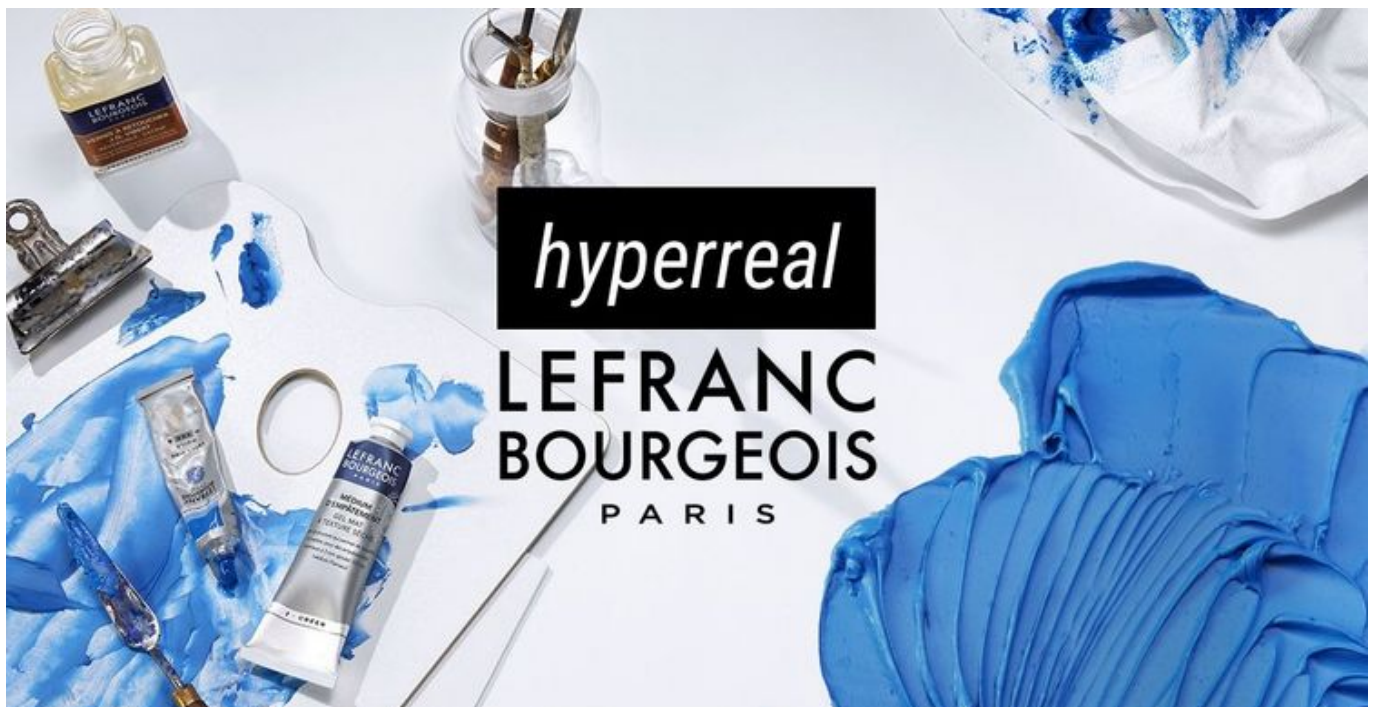
Grafika promująca wydarzenie: Konkurs Hyperreal - konkurs w pracowni artystycznej OKO , fot. mat. Warsztat Artysty

Zapraszamy wszystkich artystów do zgłaszania swoich prac do konkursu malarskiego "Hyperreal", który organizujemy, we współpracy z Lefranc Bourgeois - fundatora nagród.