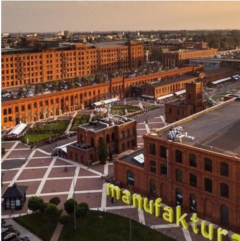
Rynek Manufaktury