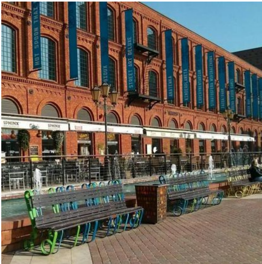
Rynek Manufaktury