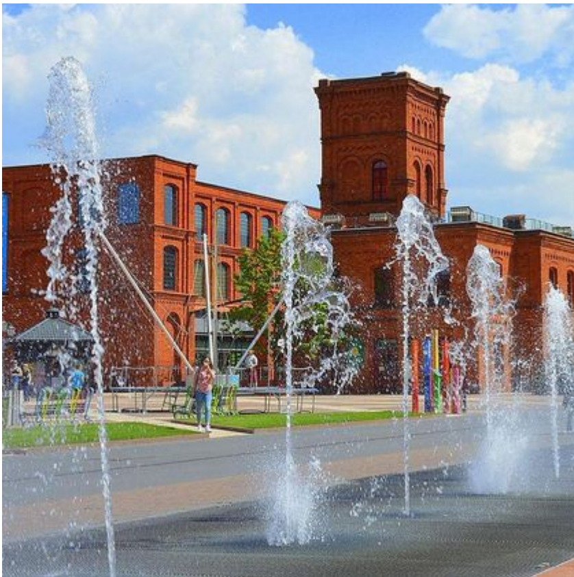
Rynek Manufaktury

Kolejną nowością są wieczorki tematyczne. We wtorki po godz. 17:00 łyżwiarze będą ślizgać się w rytm reggae – bo to wtoreaggek! Środance w środku tygodnia? Oczywiście! W każde zimowe środowe popołudnie na lodowisku królować będzie muzyka taneczna. W weekend, oczywiście najpierw Gorączka Sobotniej Nocy – czy na tafli w Manufakturze ujawni się łyżwiarski John Travolta? Z pewnością nie jeden! Niedzielatino, to z kolei okazja, by podnieść nieco temperaturę i pojeździć w rytm latynoskich hitów.