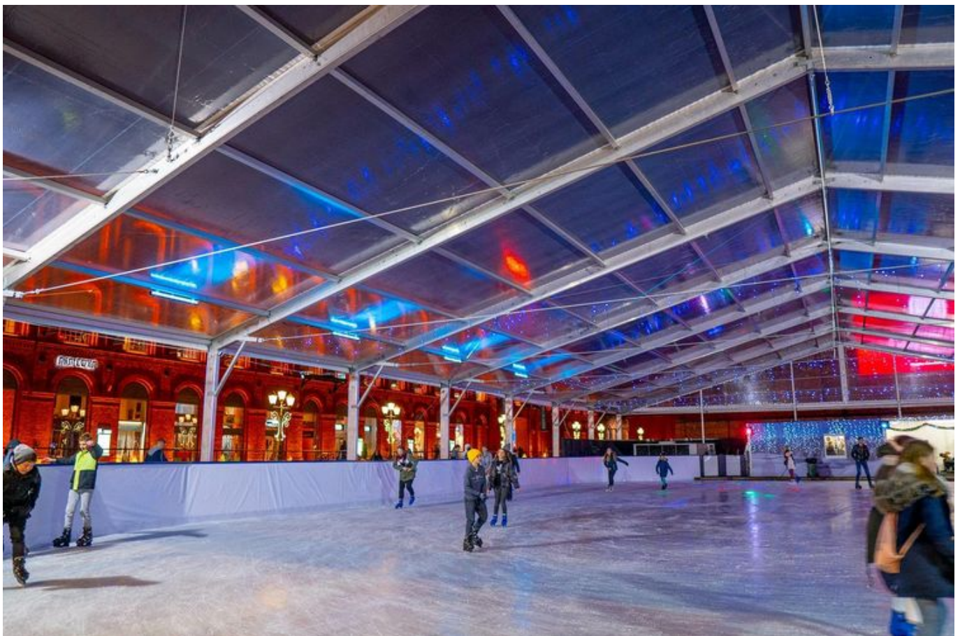
Grafika promująca wydarzenie: Lodowisko w Manufakturze

W tym roku ulubiona zimowa atrakcja łodzian przeszła metamorfozę - największą zmianą jest dach nad lodowiskiem. Będą też muzyczne popołudnia - wówczas będzie można jeździć na łyżwach w rytmie hitów z przeróżnych gatunków muzycznych.