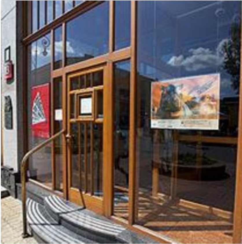
Galeria Re:Medium