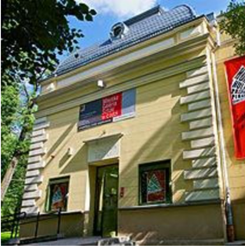
Ośrodek Propagandy Sztuki