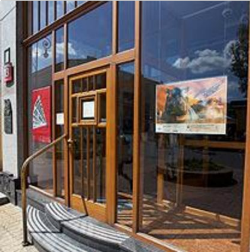
Galeria Re:Medium, fot. MGSŁ